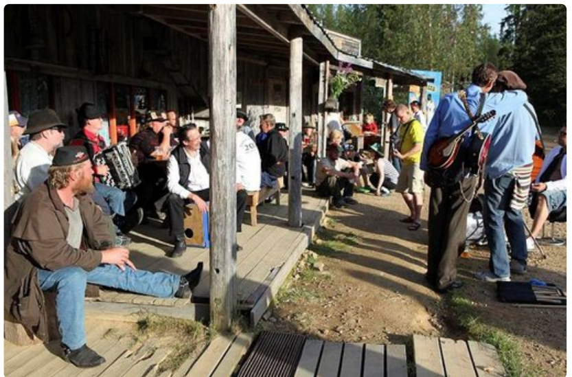
Iltapäivän auringossa viihdytään Kultakylän raitilla.