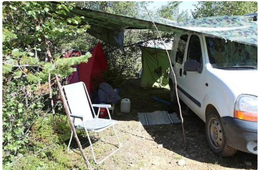
Koti kulkee mukana.