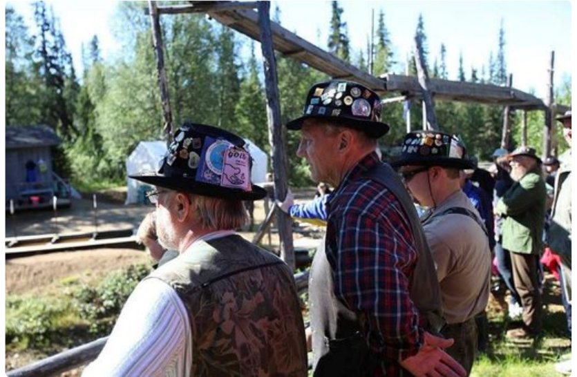
Pinssihattu ja ruutupaita ovat kultamiehen kansallispuku.