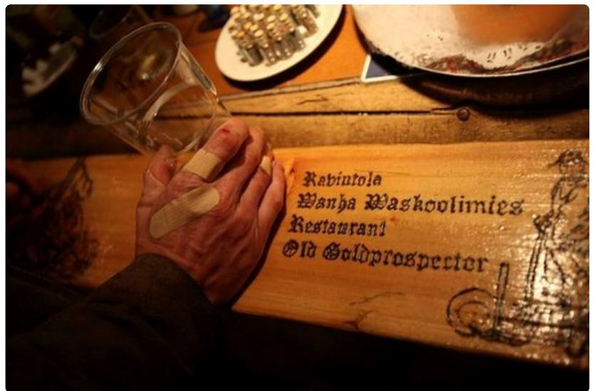
Kultamiehen kärsinyt käsi.