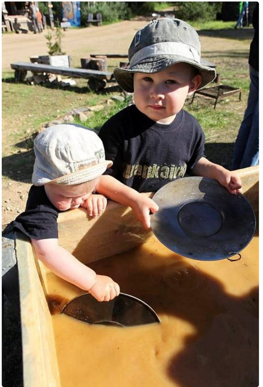
Kultakuume ei katso ikää.