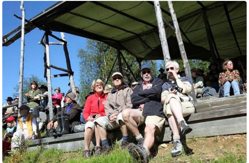
Kilpailualueen katettu katsomo suojaa tarvittaessa sateelta ja auringolta.