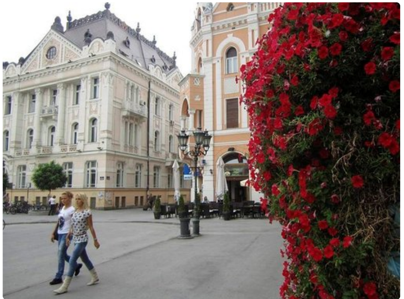
Novi Sadin keskusaukio.

Kaupunki on historiansa aikana tuhottu ja rakennettu uudelleen jopa 40 kertaa.