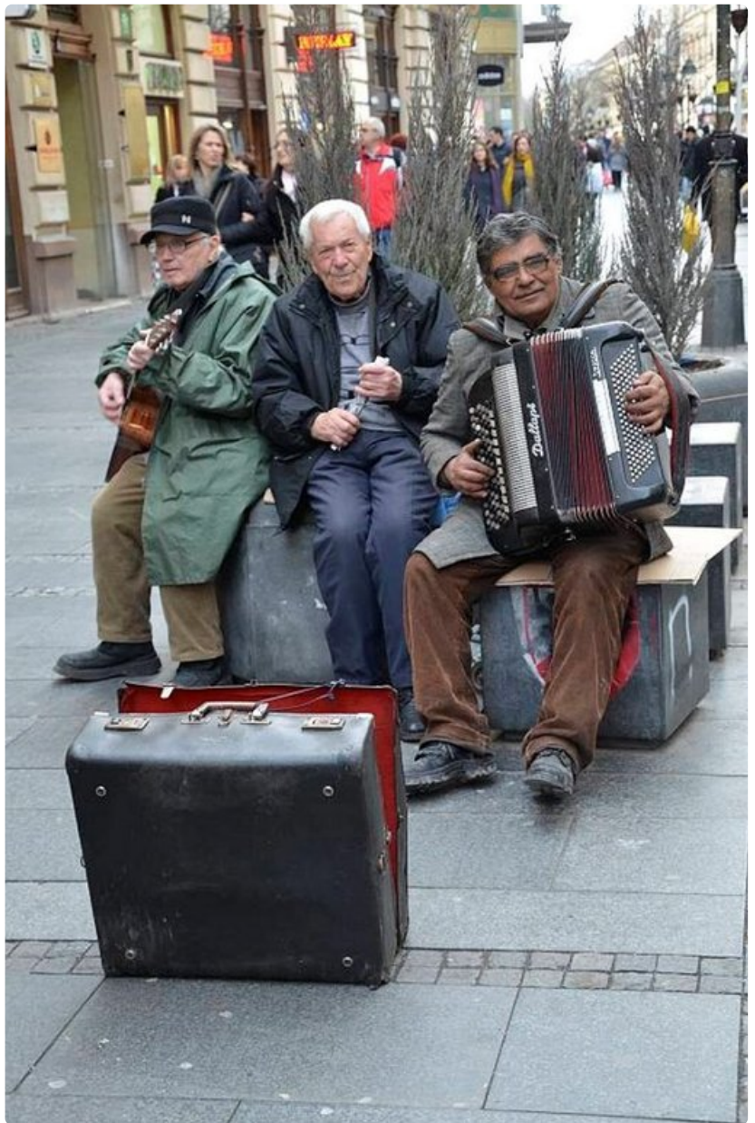
Belgradin kaduilla soi aina. Katusoitajat ovat suosittu kävelykadulla, Knez Mihailovalla, kesäisin ja talvisin, päivisin ja öisin.