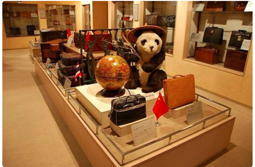
Laukkumuseossa on esillä laukkuja moneen lähtöön.