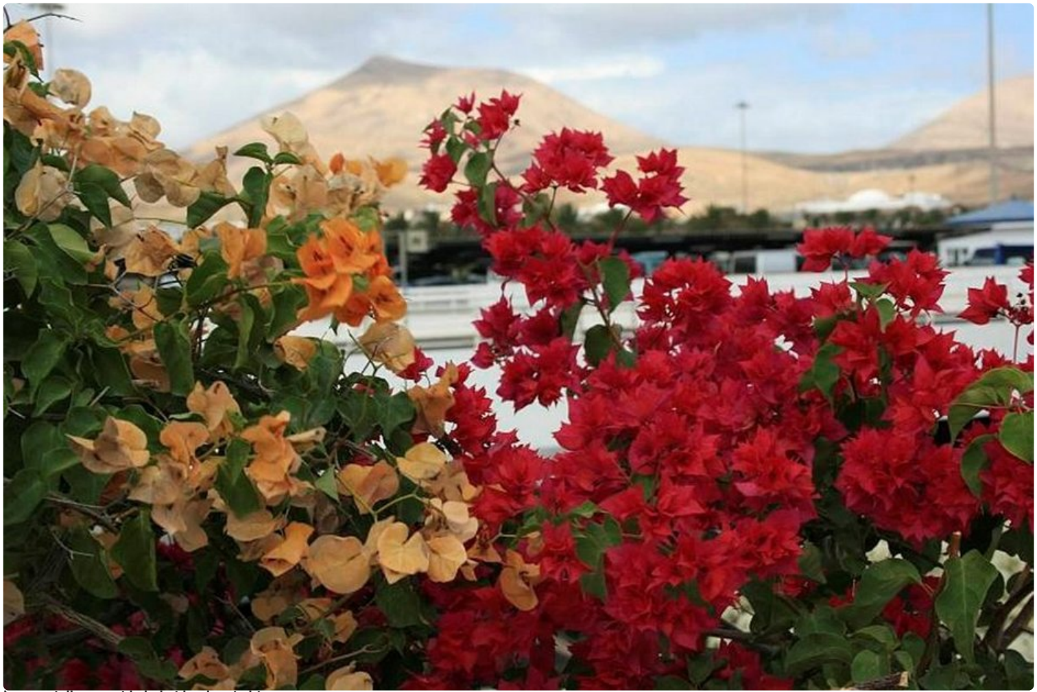
Lanzarotella vuoret ja kukat kuuluvat yhteen.