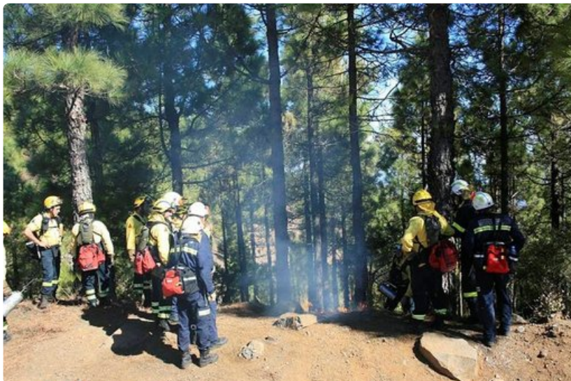
Palomiehet harjoituksessa mäntymetsässä.

Polku vie kulkijan takaisin Yaizaan. Restaurant La Era on saaren mielenkiintoisimpia ravintoloita. Ravintolarakennus on perinteistä Lanzaroten arkkitehtuuria. Ravintolan puutarha on myös kiinnostava ja sitten vain nauttimaan keittiön antimista, sillä patikointi tekee nälkäiseksi.