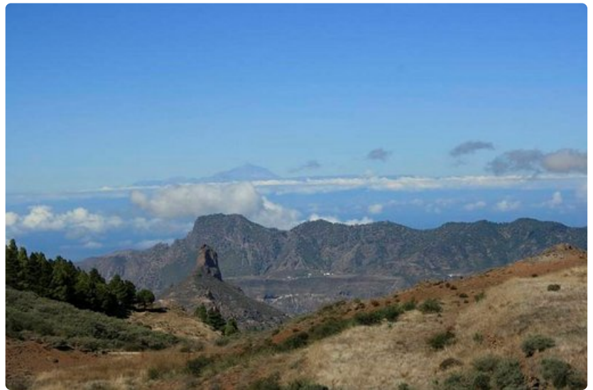
Tejedan kraatteri hallitsee Gran Canarian keskiosaa.