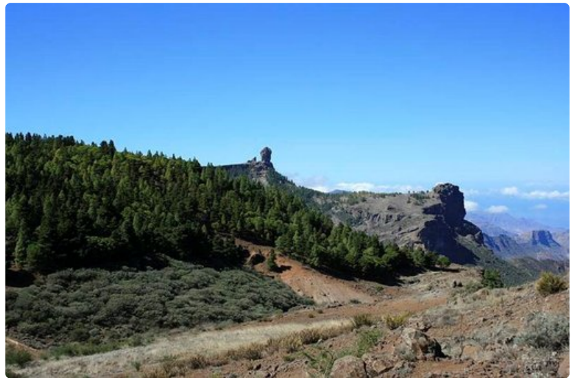
Gran Canarian symboli, Roque Nublo -kivi seisoo 1813 metriä meren yläpuolella.