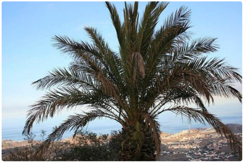
Bandaman näköalapaikalta näkee Las Palmasin kaupunkiin.