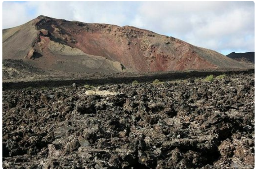
Kolmasosa Lanzaroten pinta-alasta on laavakentän peitossa.