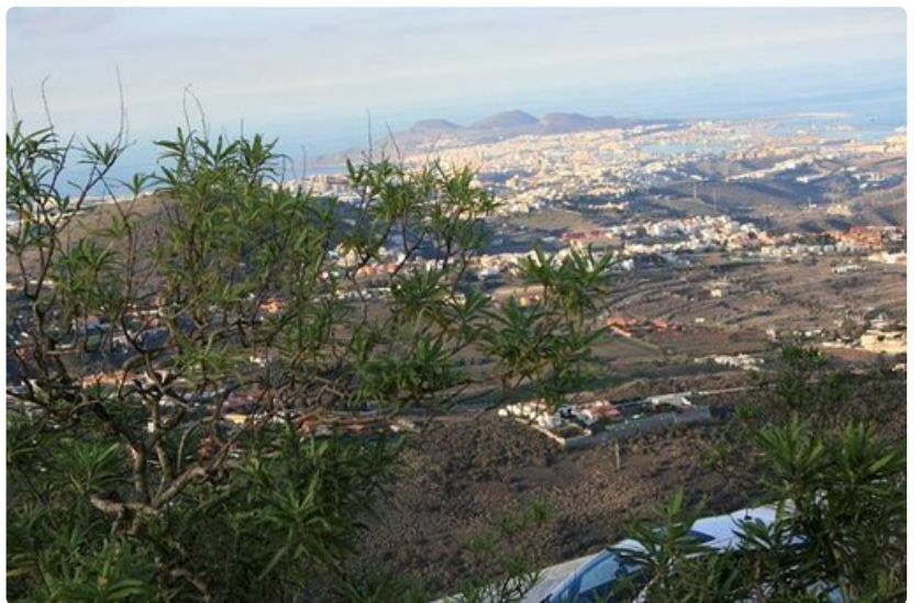
Las Palmas avautuu patikoijalle monesta suunnasta.