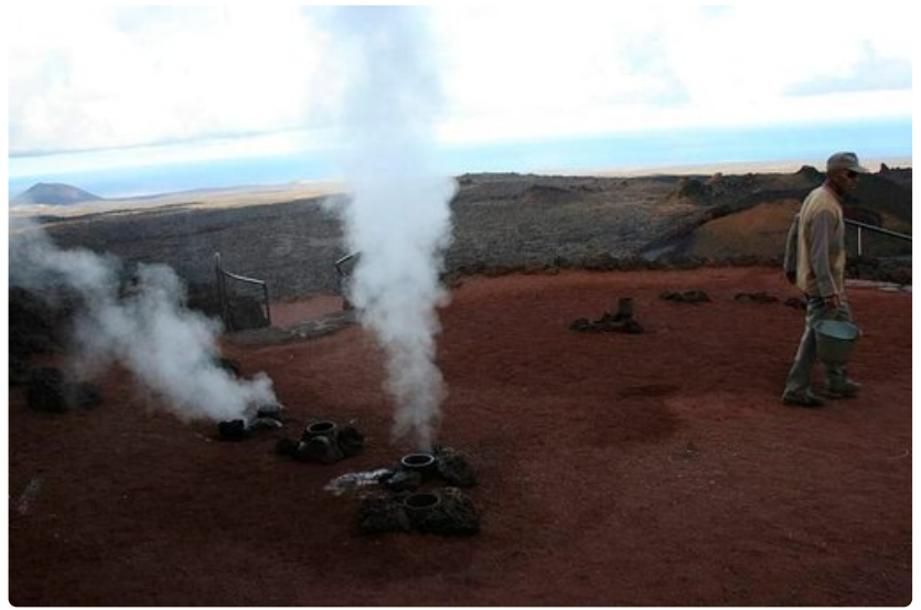
Volcán de Fuego -vuori kiehuu Lanzarotella.

Cruz de Tejedan kylä on saaren keskipiste, joka sijaitsee 1510 metrin korkeudessa. Siellä seisoo kivistä veistetty Kristus-patsas. Monet kanarialaiset perheet tulevat vilkkaaseen kylään syömään viikonloppuisin. Kristus-patsaan takana on Parador-hotelli, josta saa paikallisia herkkuja kuten vuohenjuustoa, karitsaa ja kanarialaisia viinejä. Lounas maksaa 10-15 euroa. Tejedasta pääsee bussilla takaisin Maspalomasiin tai Terorin kaupunkiin.