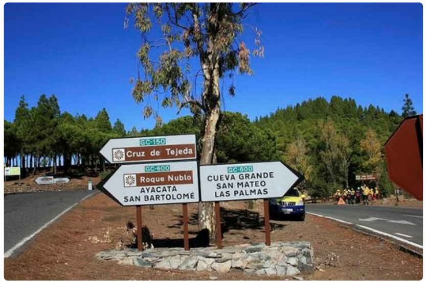
Gran Canaria on pienekö saari eikä tieveroa ole, mutta maastovaihteluiden vuoksi myös lyhyeen matkaan saattaa mennä yllättävän paljon aikaa. On tärkeää lukea patikointireittien opasteet.

Patikointi Lanzarotella on erilaista kuin Gran Canarialla. Tuuli puhaltaa lähes aina, ja monet reitit on asfaltoitu, koska suuri osa saaresta on laavan peitossa ja kolmasosa saaresta on suojeltu.