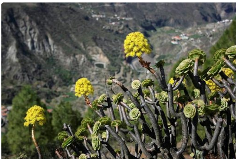
Tabaiba- ja aeonium-kasvit kestävät pitkiä aikoja ilman vettä.