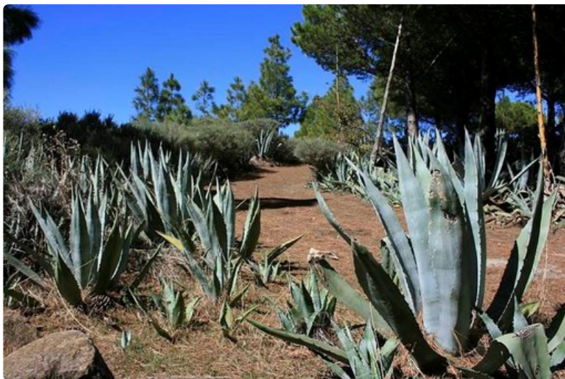
Suurin osa patikointireiteistä on hoidettu hyvin.