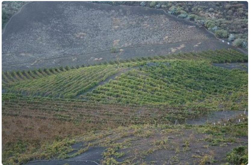
Viiniviljelmä Gran Canarian vulkaanisella maaperällä.