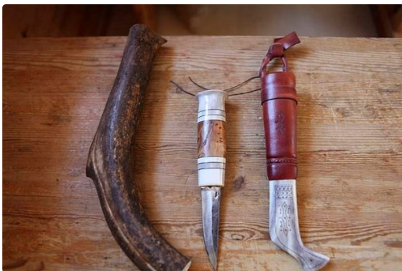
Poronluinen puukko on arvokas lahja.