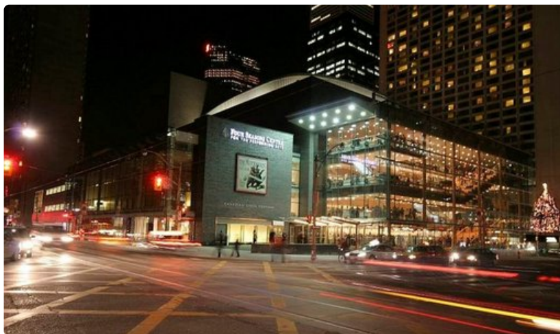
Toronton uusi oopperatalo on lasipalatsi kaupungintalon lähellä.