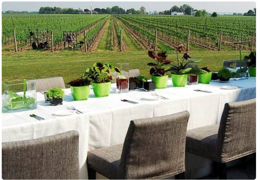
Niagaran niemimaa on kuuluisa myös yli 50 viinitarhastaan.