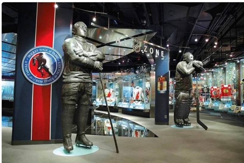
Hockey Hall of Fame -pyhätössä on muun muassa Stanley Cup -pokaalin koti.