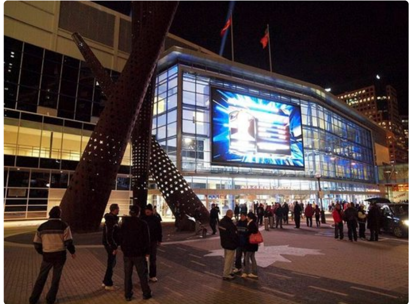
Air Canada Centre on näyttävä urheilu- ja konserttipaikka.

Eaton Centren kauppakeskuksessa on 300 myymälää viidessä kerroksessa.