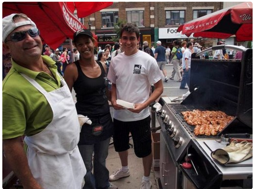
Taste of Danforth -katufestivaali tarjoaa kreikkalaisia herkkuja.