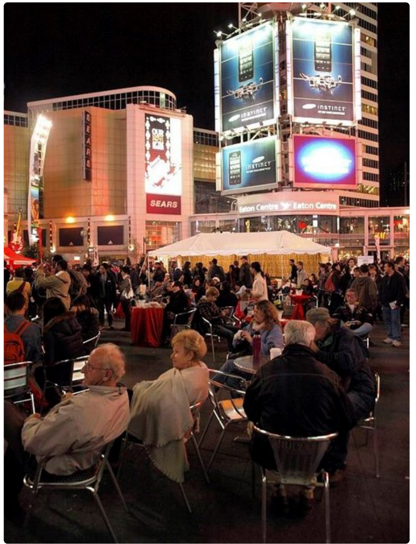
Dundas-aukion vilkas iltaelämä houkuttelee matkailijoita viihtymään.