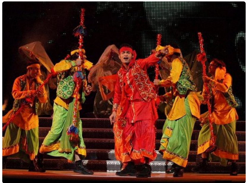
Bollywood-tanssijat tuovat etnisen tuulahduksen Intiasta.

Uuden sisäänkäynnin rakentaminen vuonna 2007 oli kiistelty nuorennusleikkaus edvardinaikaiseen rakennukseen. Teräksestä, lasista ja alumiinista rakennettu huippumoderni lisäys sai ulkonäkönsä mukaan nimen "Chrystal". Kävijä voi itse arvioida sen sopivuuden.