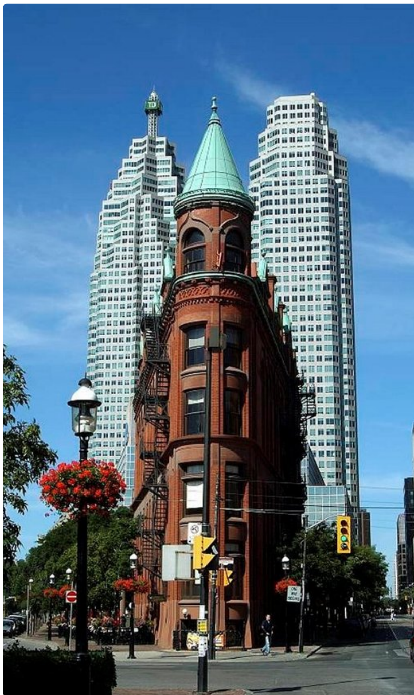
Gooderham-whiskytehtaan vanha pääkonttori - vanhaa ja uutta rinnakkain.

St. Jacobs-kylä puolestaan tunnetaan mennoniitti-yhteisöstään, joka on säilyttänyt yksinkertaisen ja uskonnollisen elämäntyylinsä jo yli 300 vuoden ajan. Mennonitit eivät käytä moderneja työkaluja eivätkä sähköä. Matkansa he taittavat mustilla hevöskärryillä.