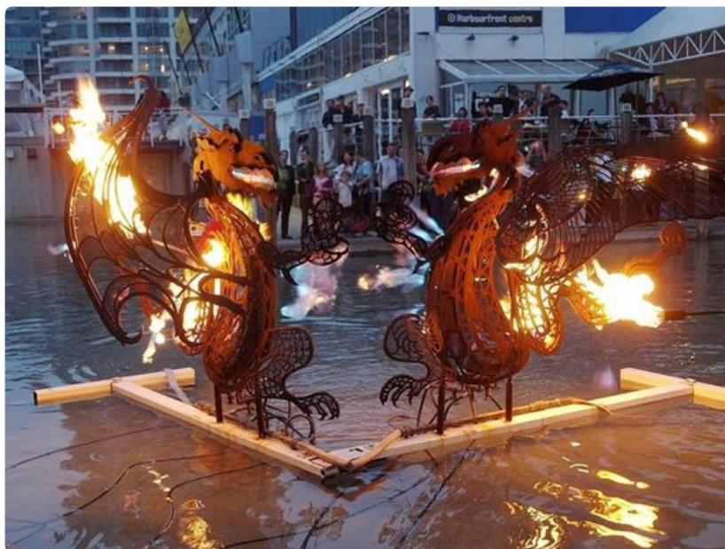
Harbourfront-festivaali esittelee luovaa taidetta.