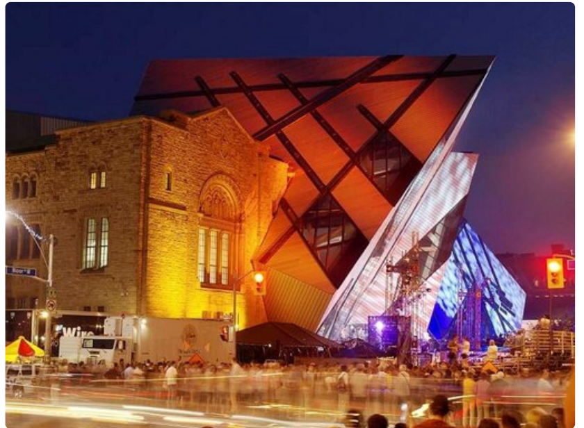
Royal Ontario -museon uusi sisäänkäynti, Chrystal, on nuorennusleikkaus edvardinaikaiseen rakennukseen.