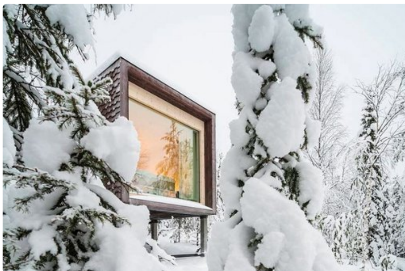
Napapiirillä Santa Park -huvipuiston alueella sijaitseva hotelli on kokonaisuudeltaan Suomen erikoisin. Olohuoneesta avautuu koko seinän kokoinen ikkuna lappilaiseen luontoon ja talvella suoraan revontulielämyksiin.