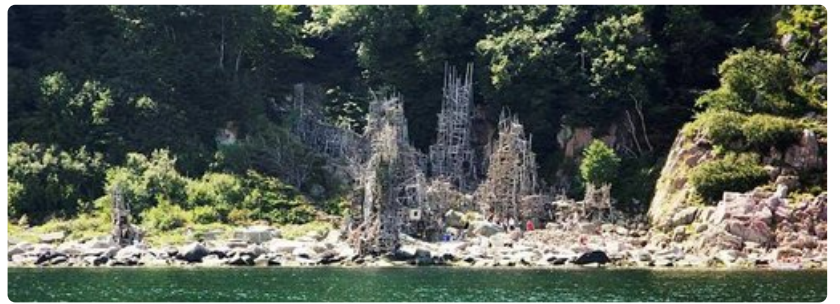
Ladonian rantaviivaa. Ruotsin valtio määräsi kyseisen kyhäelmän purettavaksi.