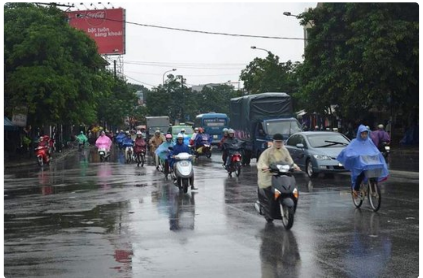
Hue on liikenteen osalta hiljainen Saigoniin verrattuna.

Historiallisten nähtävyyksien lisäksi Huessa voi tutustua myös Vietnamin nykyelämään. Ostoksia voi tehdä putiikeissa, kadunvarsikojuissa tai täyteen ahdetussa basaarissa, jossa tunnit kuluvat sukkelasti.