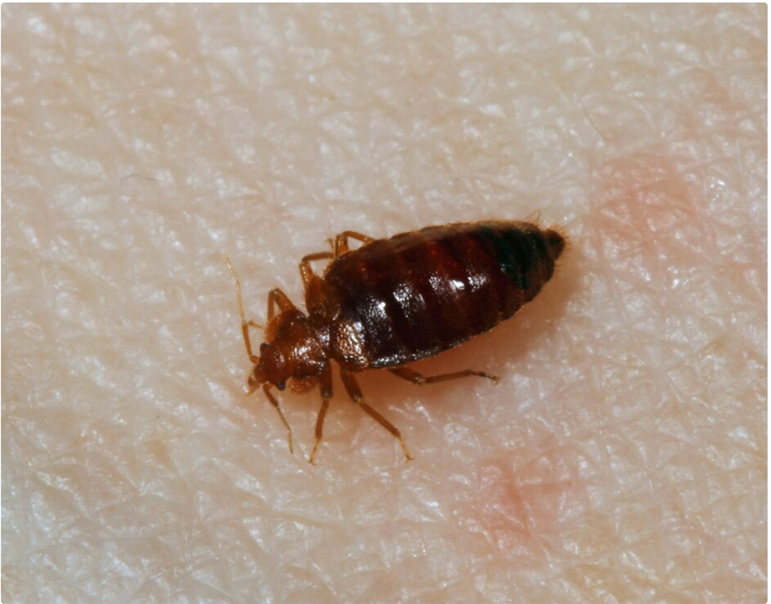
Aikuinen lutikka on noin 4–6 mm pitkä, litteä, soikea ja punaruskea hyönteinen, eli suunnilleen omenansiemenen kokoinen. Nuoret yksilöt eli nymfit voivat olla vaaleampia ja läpikuultavia ennen ensimmäistä veriateriaansa.

Yksi yö hotellissa voi tuoda kalliin ongelman – näin suojaat kotisi luteilta