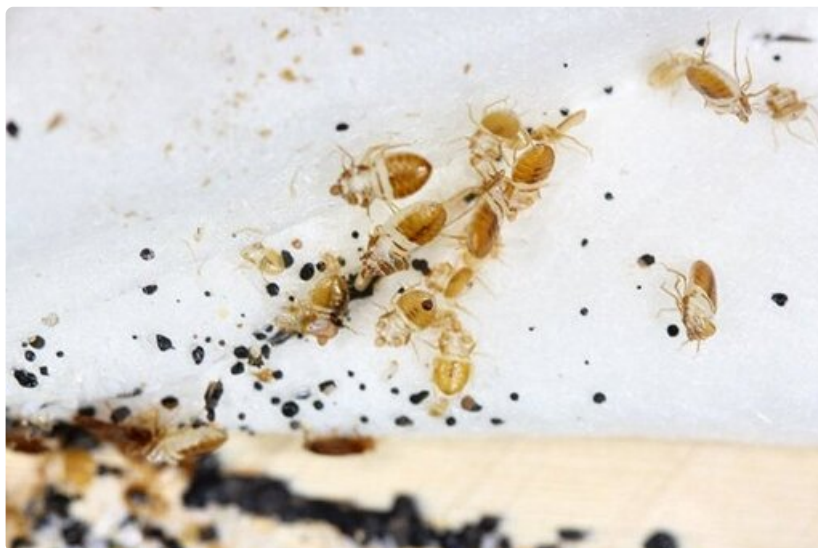
Lutikan ulosteet näkyvät sängyn rakenteissa pieninä, mustina pilkkuina. Nymfit luovat nahkansa monta kertaa, ja tyhjiä nahkoja saattaa myös löytyä sängyn rakenteista.

"Lutikkaongelma ei ole harvinainen eikä häpeä, mutta mitä nopeammin se havaitaan ja hoidetaan, sitä helpompi se on ratkaista", Siltala muistuttaa.