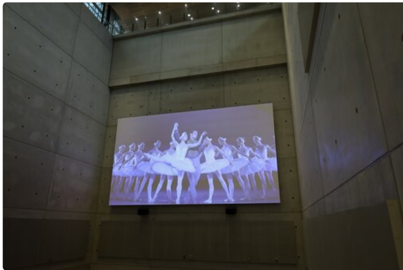
Joutsenlampi on yksi Kulttuurinäyttämöllä esitettävistä teoksista.

Kulttuurinäyttämön ohjelmistosta tarkemmin Finavian verkkosivuilta .