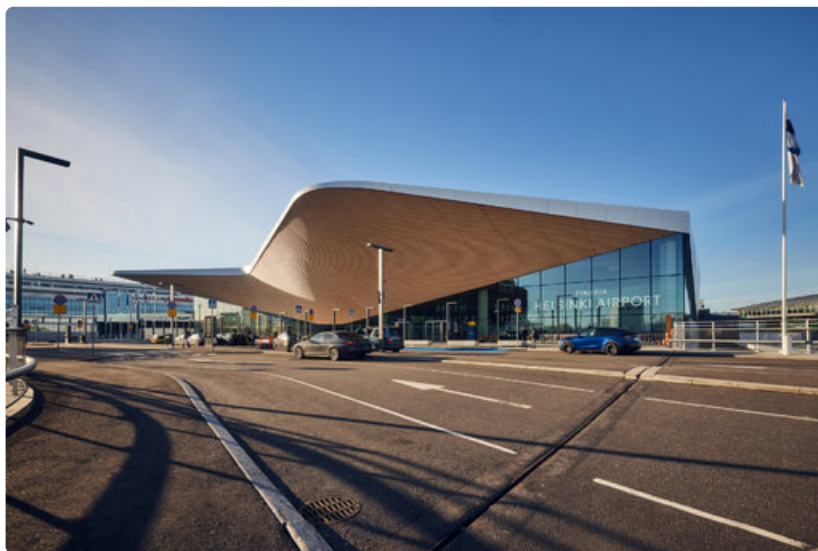
Helsinki-Vantaan lentoaseman terminaali. Helsinki Airport terminal.

Myös liikematkustajat arvioivat Helsinki-Vantaan lentoaseman maailman parhaimmiston. Helsinki-Vantaa sijoittui maailman viiden parhaan joukkoon helmikuun lopussa julkaistulla listalla.