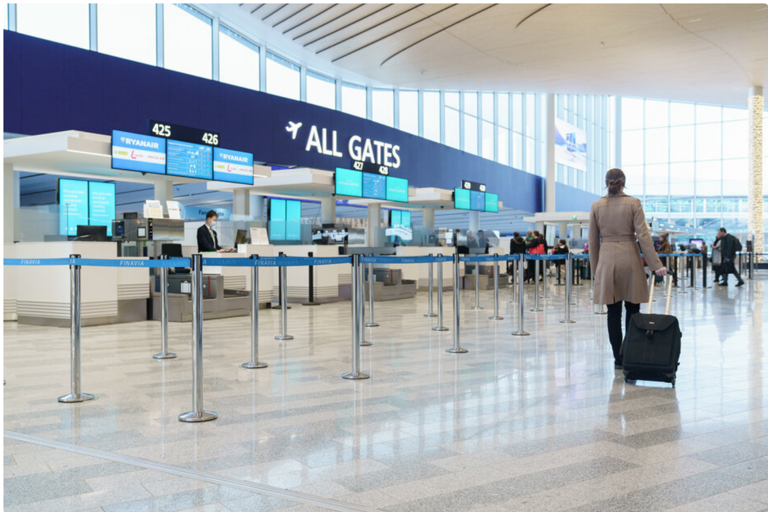
Helsinki-Vantaan lentoaseman lähtöaula.