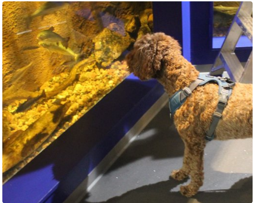
Maretariumin kaloissa riitti ihmeteltävää.