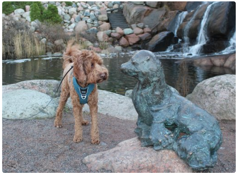
Sapokan vesipuisto on rentouttava paikka ihmisille ja koirille. Kivielläimetkin kiinnostivat karvatassua.

Raku-koiran kanssa on siellä hauska kierrellä ja tavata muitakin koiranulkoiluttajia. Koiran huomio kiinnittyi muun muassa useisiin eläinaiheisiin kivipatsaisiin. Niille voi hiukan muristakin ilman mitään vastamurinaa.