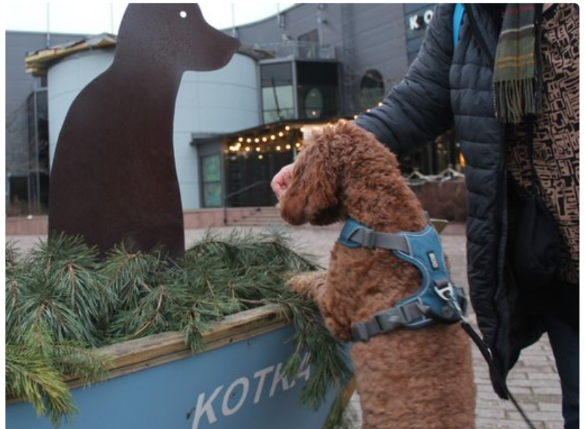
Kotkassa päästiin katselemaan kauniita Santalahti Resortin maisemia. Myös ravintola Wanha Fiskari otti koiran ystävällisesti vastaan.