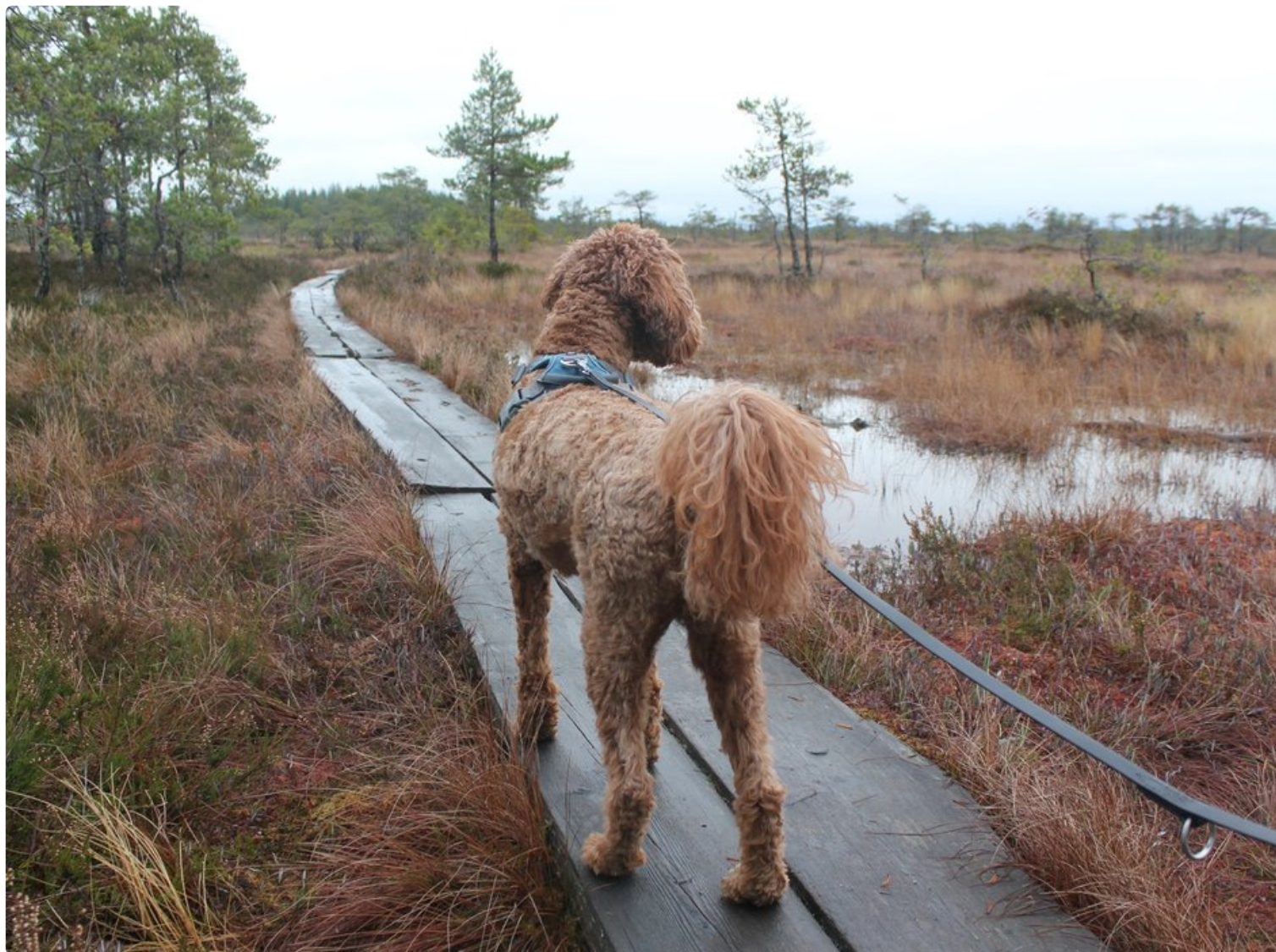
Valkmusan kansallispuiston soilla koirakin liikkuu kätevästi pitkospuita pitkin.