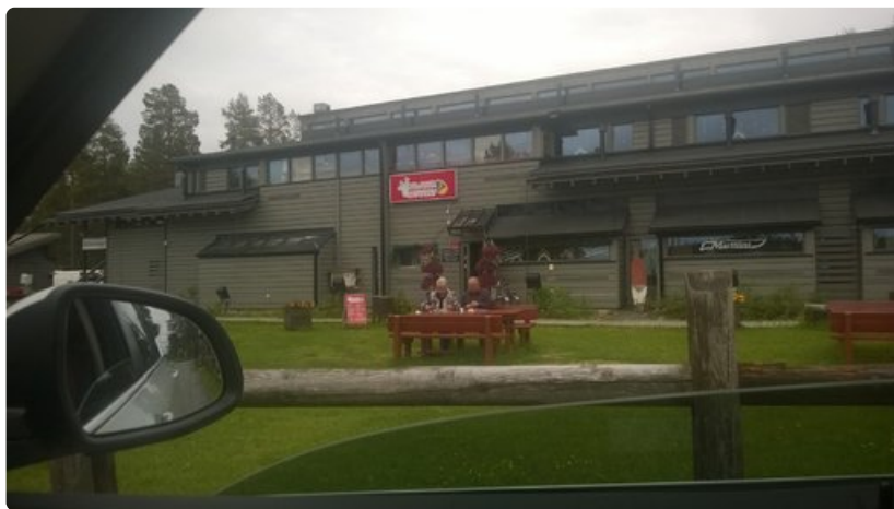
Tanskalaispariskunta lounasti omia eväitään suomalaisravintolan terassilla.

Katso video: https://www.facebook.com/jorma.aula