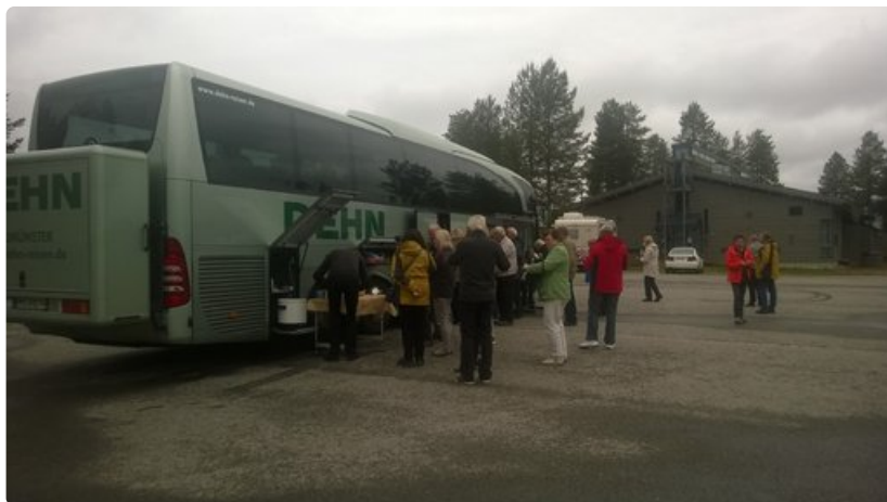
Vajaan sadan metrin päässä tanskalaisbussista saksalaiset pystyttivät lounaspöytiä samaisella Napapiirin alueen parkkipaikalla. Bussin takaosaan asennettu jättiboksi kertoo, että mukana lienee enemmänkin evästä.