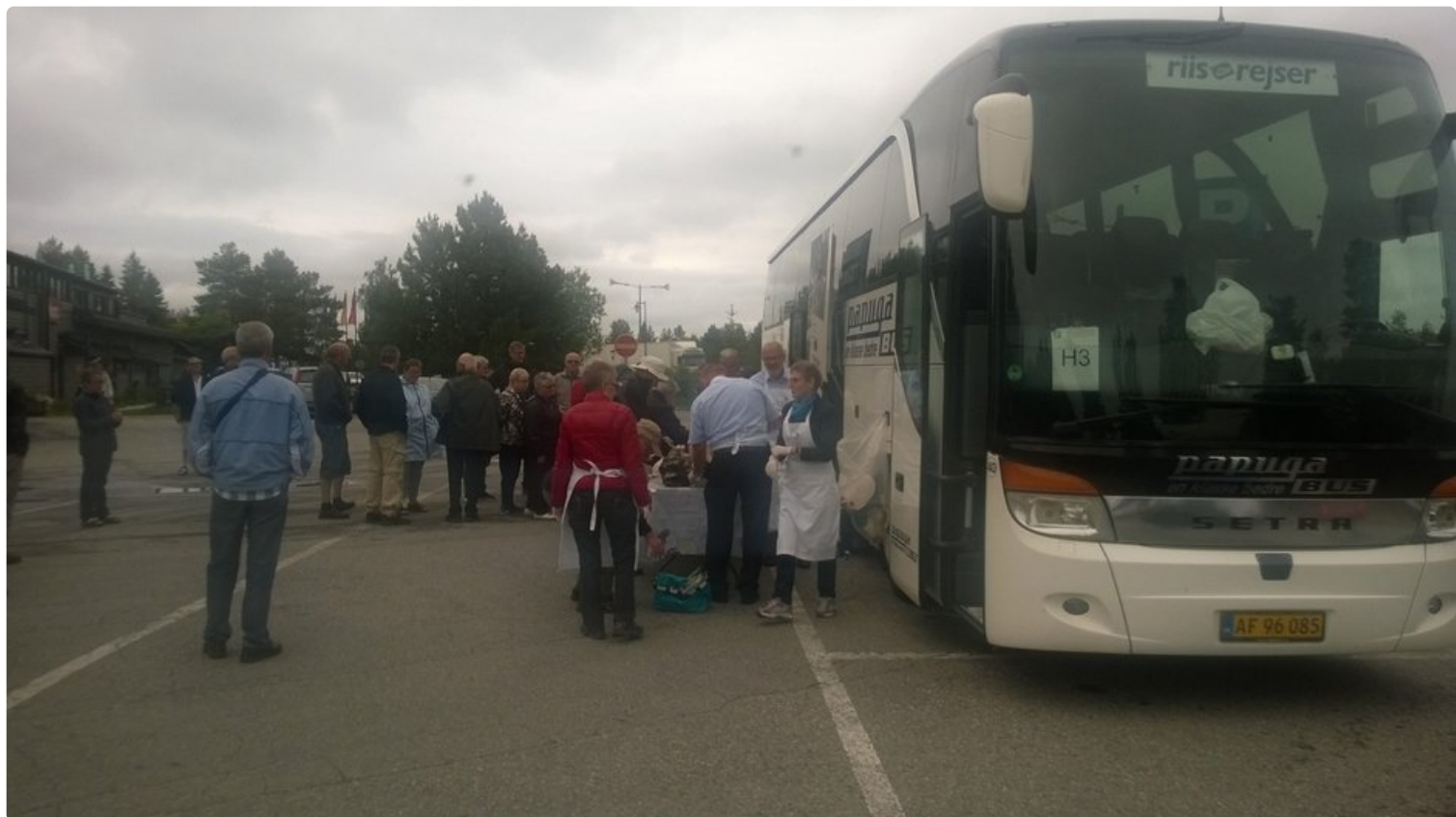
Tanskalainen matkanjärjestäjä kuljettaa bussin ruumassa ruoat ja juomat mukanaan. Tässä 50 matkailijaa nauttii lounasta Rovaniemen Napapiirillä bussin kylkeen katetuilta pöydiltä.