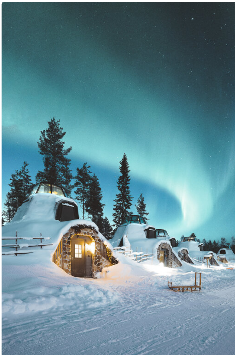
Kammi Glass Igloo Suite at Apukka Resort, Rovaniemi, Lapland Finland.

Yritysjärjestelyt astuvat voimaan kilpailuviranomaisten hyväksynnän jälkeen ennen kesää.