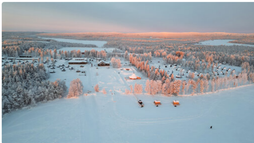
Apukka Resort, Rovaniemi. Matkailukeskus on rakentunut ja sittemmin rajusti laajentunut entisen maatalouden tutkimuskeskuksen tiloihin ja alueelle.