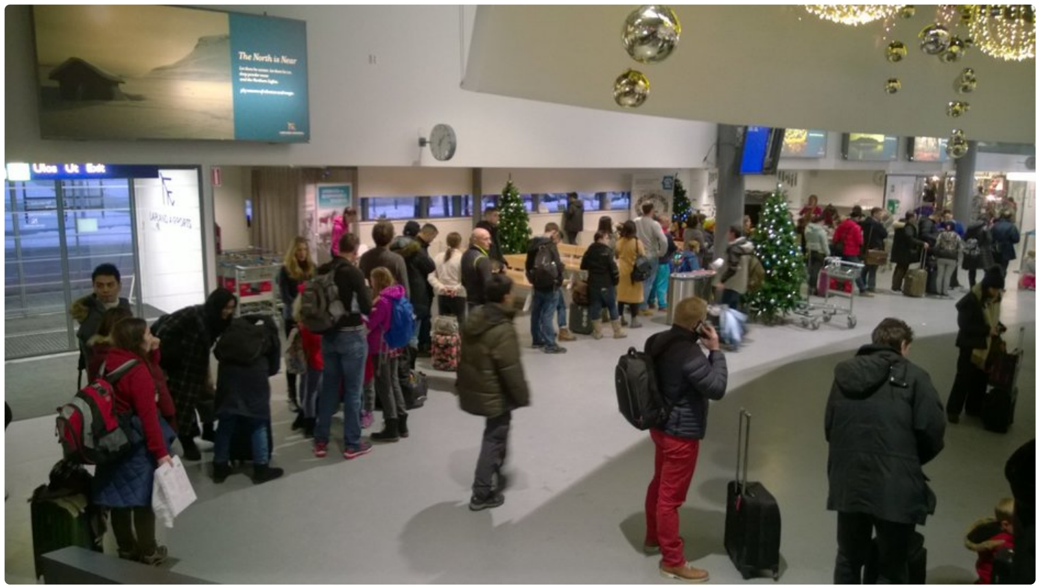
Rovaniemen turvatarkastus pakahtumassa ruuhkaan