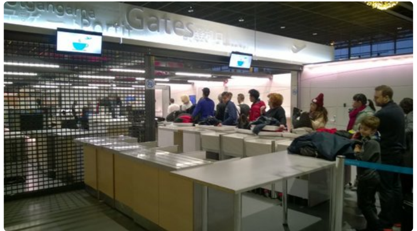
Rovaniemen lentoaseman toinen turvatarkastuslinja pysyi suljettuna ruuhkasta huolimatta.