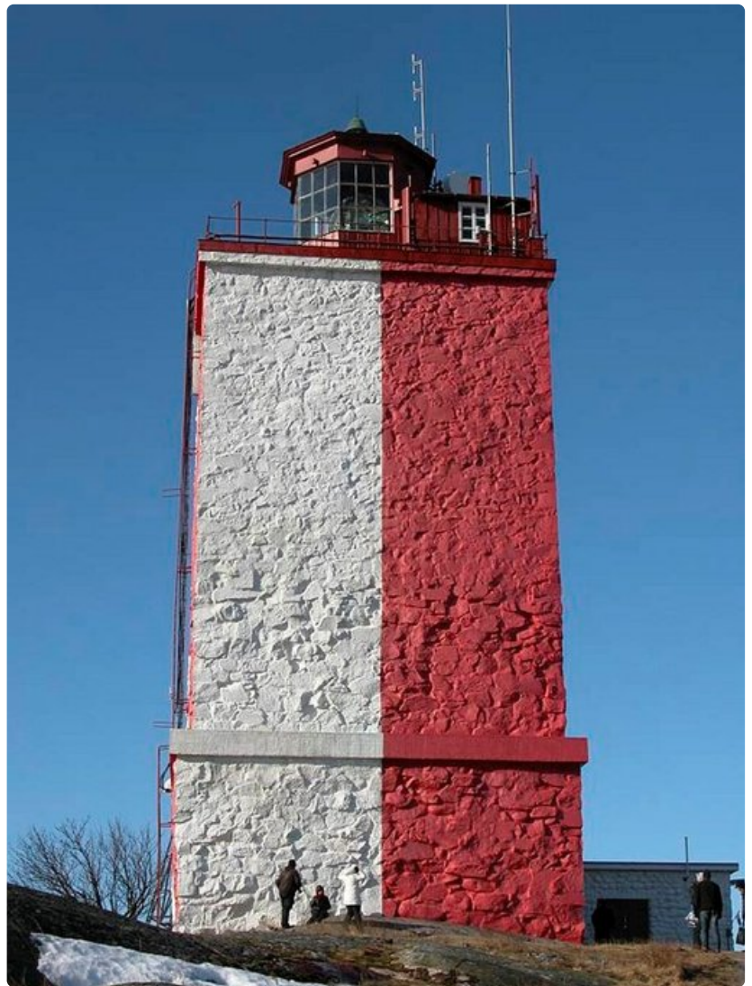
Punavalkoinen majakka on Utön tunnusmerkki. Majakkaan ja Utön historiaan pääsee tutustumaan opastetulla kierroksella.