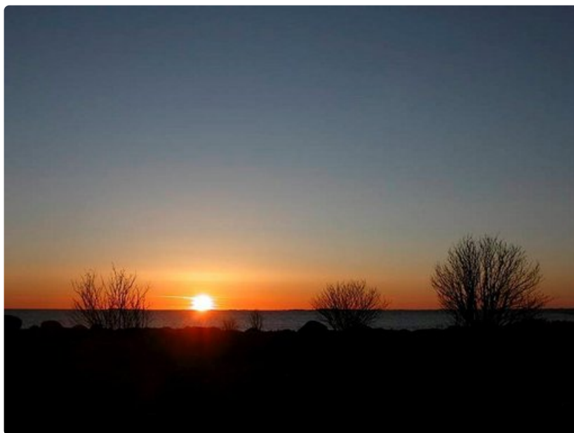
Auringonlasku aavalle ulapalle on yksi Utön päänähtävyyksistä - ja syystä.