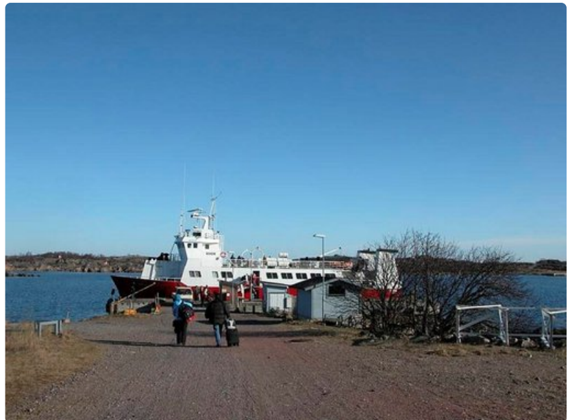
Yhteysalus m/s Eivor liikennöi Utöhön läpi vuoden. Talvisin matka taitetaan viisi kertaa viikossa.