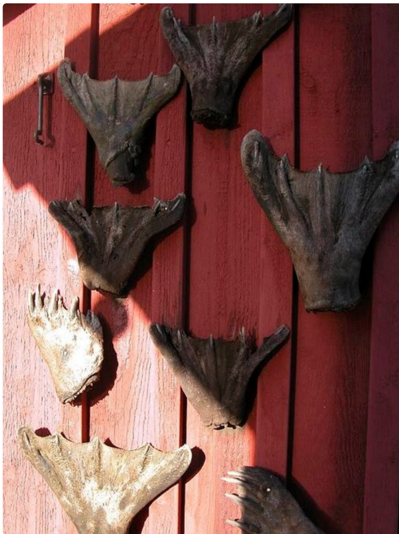
Näkymä rantavajan seinustalla.

Harva Utön-kävijä ei pala halusta palata takaisin.