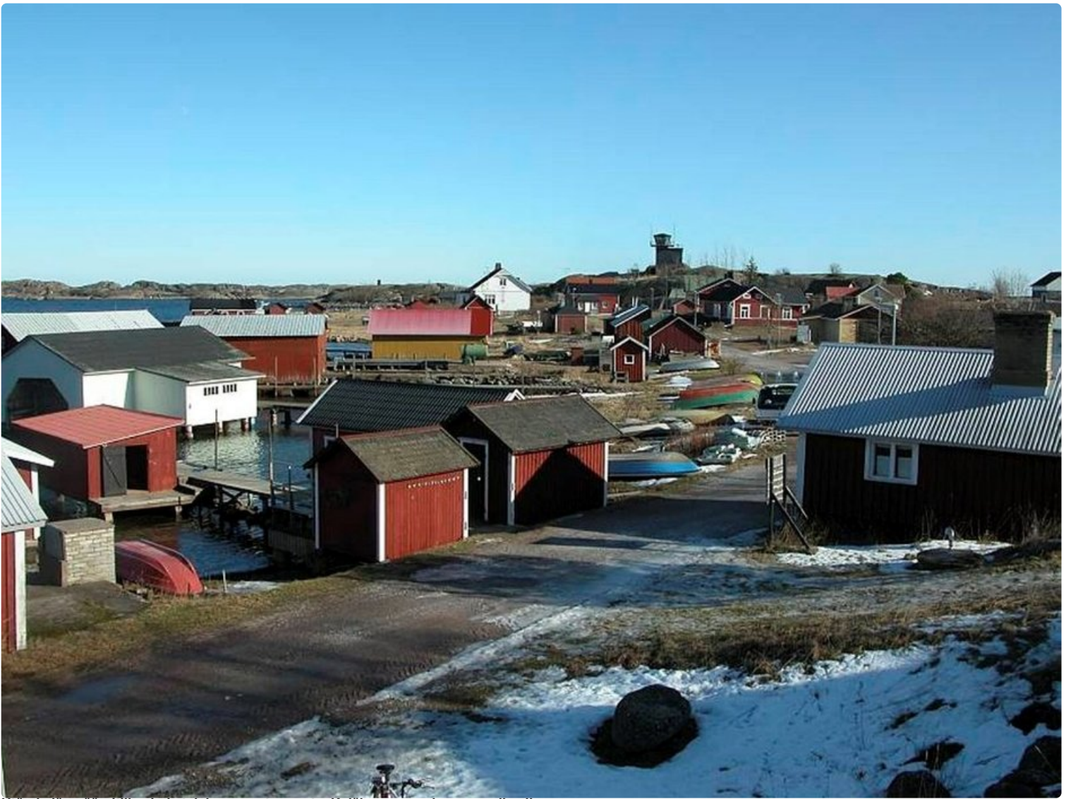
Utön kylän pääraitilla ei ole talviaamuna tungosta. Kyläkauppa on kuvassa oikealla.