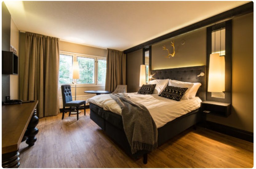
Tampereen hotellin huone ja ravintola (alla).