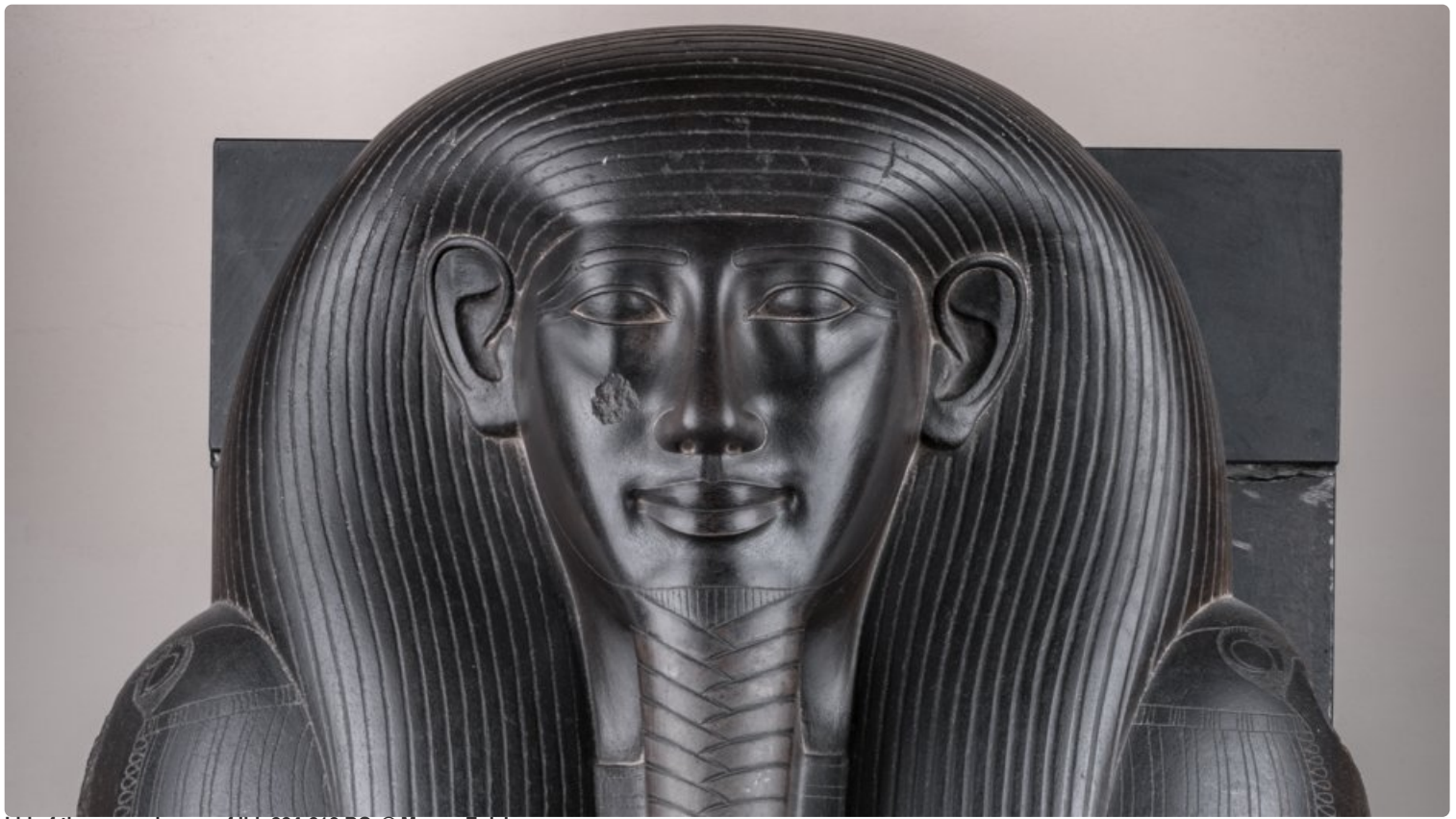
Lid of the sarcophagus of Ibi, 664-610 BC.