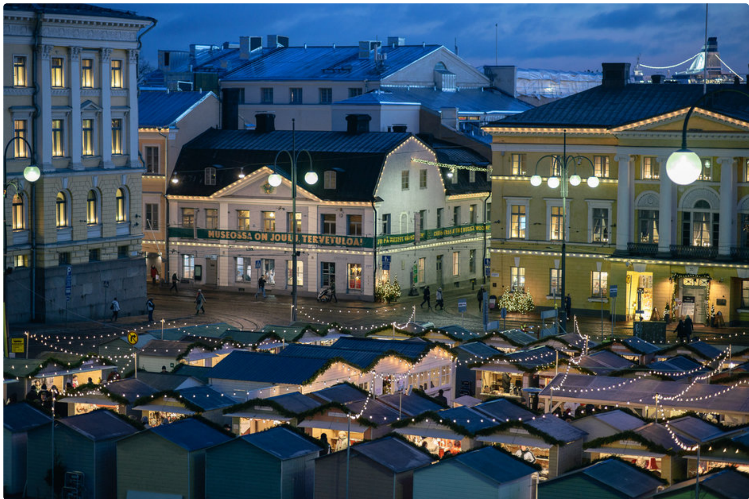
Helsingin kaupunginmuseo Senaatintorin kulmalla.