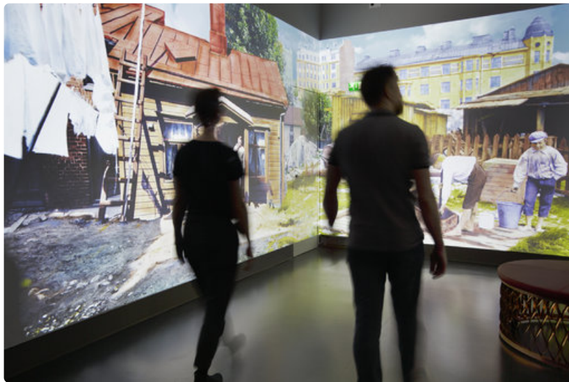
Huhtikuussa 2019 kaupunginmuseossa avataan virtuaalielämys Aikakoneen uusi versio 2.0. Aikakoneessa Signe Branderin sadan vuoden takaiset valokuvat heräävät eloon uuden teknologian avulla.

Huhtikuussa museossa avataan myös virtuaalielämys Aikakoneen uusi versio 2.0. Aikakoneessa Signe Branderin sadan vuoden takaiset valokuvat heräävät eloon uuden teknologian avulla.