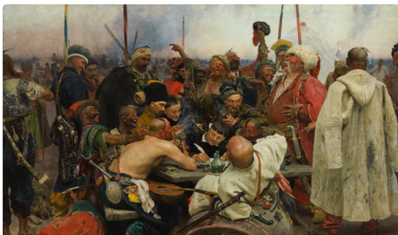
Ilja Repin: Zaporogit kirjoittamassa pilkkakirjettä Turkin sulttaanille (1880–1891). Venäläisen taiteen museo.