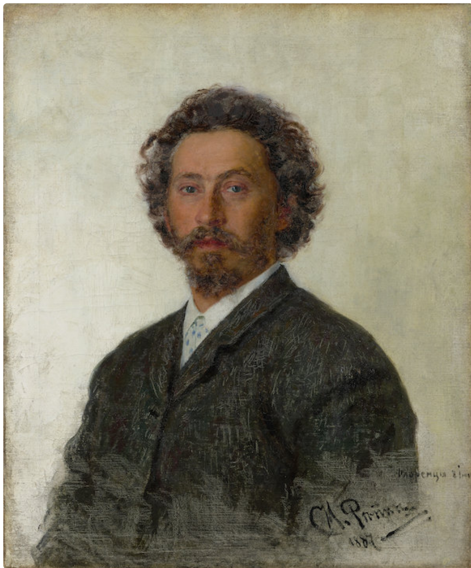
Ilya Repin: Omakuva (1887). Tretjakovin galleria.