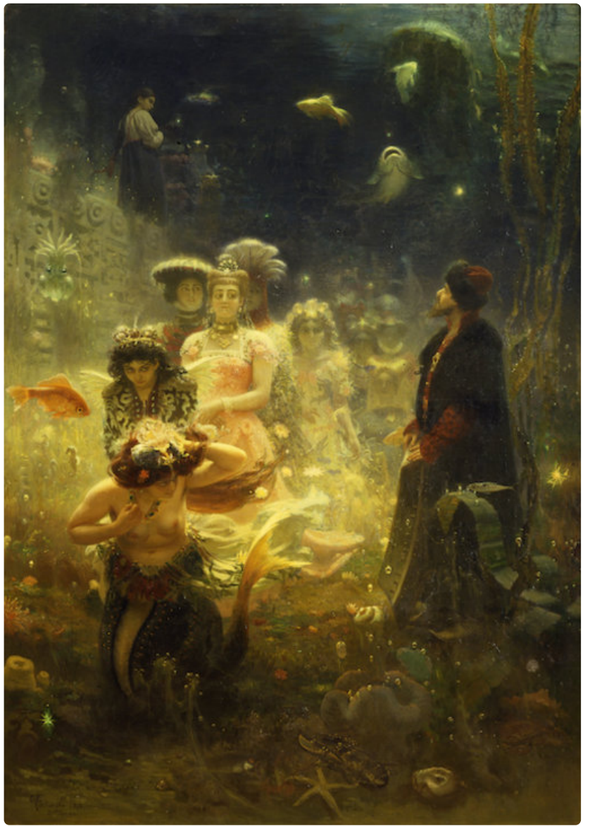
Ilja Repin: Sadko vedenalaisessa valtakunnassa (1876). Venäläisen taiteen museo.