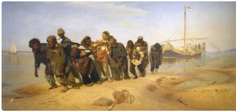
Ilja Repin: Ristisaatto Kurskin kuvernementissa (1881–1883). Tretjakovin galleria.

Normaali pääsymaksu 17 € | Alennettu pääsymaksu 15 € | Alle 18-vuotiaat maksutta