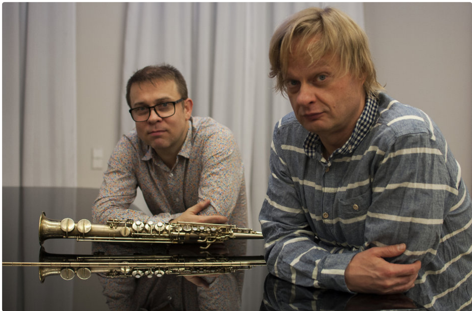
Valkeakoskella esiintyvät myös Jukka Perko ja Iiro Rantala.