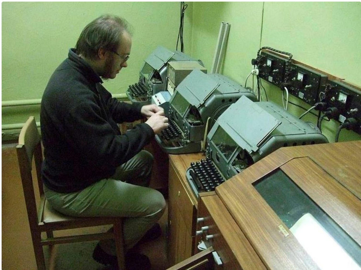
Bunkkeri on kuin telemuseo. Näitä laitteita opas kutsuu telefaxin isoiksi. Niitä käytettiin Sveitsissä vielä viime vuosina, sillä niiden tietoturva on 100-prosenttinen.