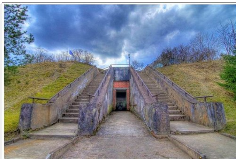
Bunkkerin huolto-ovet olivat neuvostoaikana nähneet vain harvat ja valitut - mutta kaiketi se oli tuttu myös Naton ottamia ilmavakoilukuvia tarkastelleille.