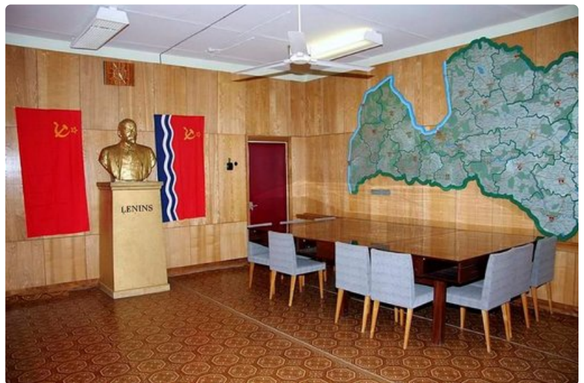
Jotta kokoushuoneen seinälle saatiin Latvian suurikokoinen kartta, se piti ryöväitä maatalousministeriöstä. Tosin se on maan kolhoosikartta, josta löytyy sellaisia kolhoosien nimiä kuten "Leninin Kipinä" ja "Punainen Nuoli".