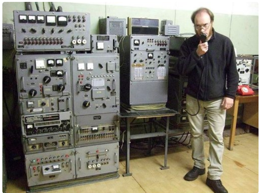
Viestintähuoneessa saattoi elää kolme kuukautta ilman konkreettista kosketusta ulkomaailmaan.