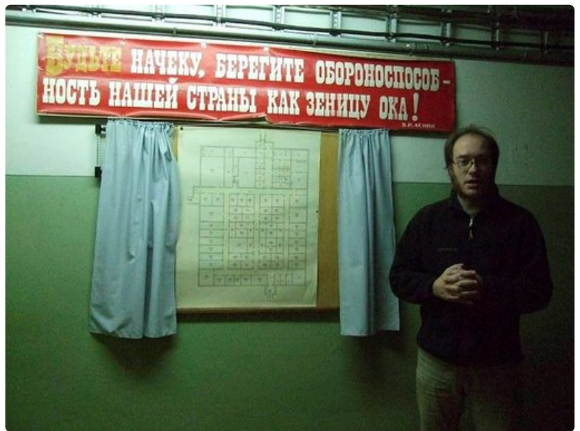
Verhojen välissä on bunkkerin pohjapiirros ja seinällä teksti: Oikaa varuillanne, varjelkaa maamme puolustuskykyä kuin silmäteräänne!

Jos ei ole liikkeellä omalla autolla, Latvian Country Tourism Association suosittelee jatkamaan Riiasta eteenpäin: vuokra-autolla tai junalla Siguldaan, josta loppumatka taksilla, sillä paikallisbussit kulkevat harvoin eivätkä niiden aikataulut ole välttämättä yhteensopivia juna-aikataulujen kanssa. Riiasta voi myös ottaa