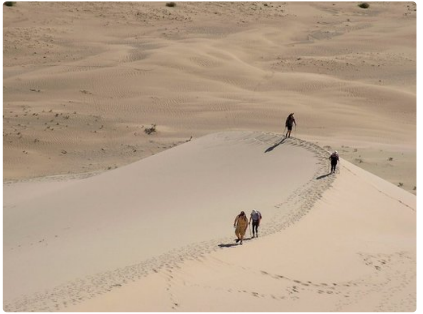
Aavikot kuuluvat Mongoliaan, varsinkin Gobin autiomaa on niistä kuuluisa.