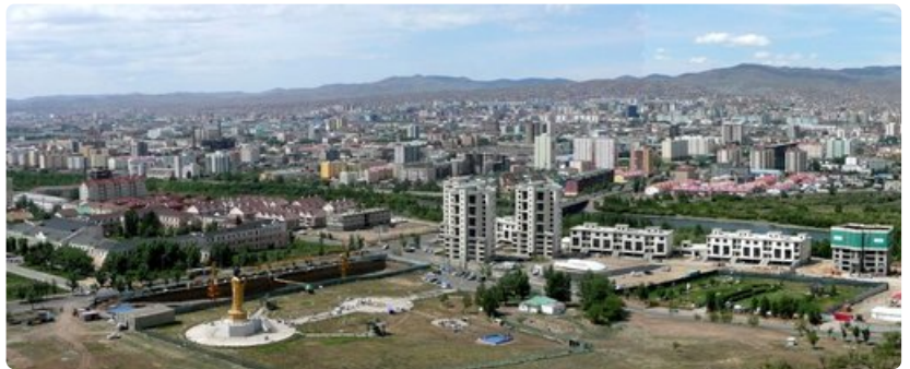
Ulan Bator on nykyään iso metropoli.