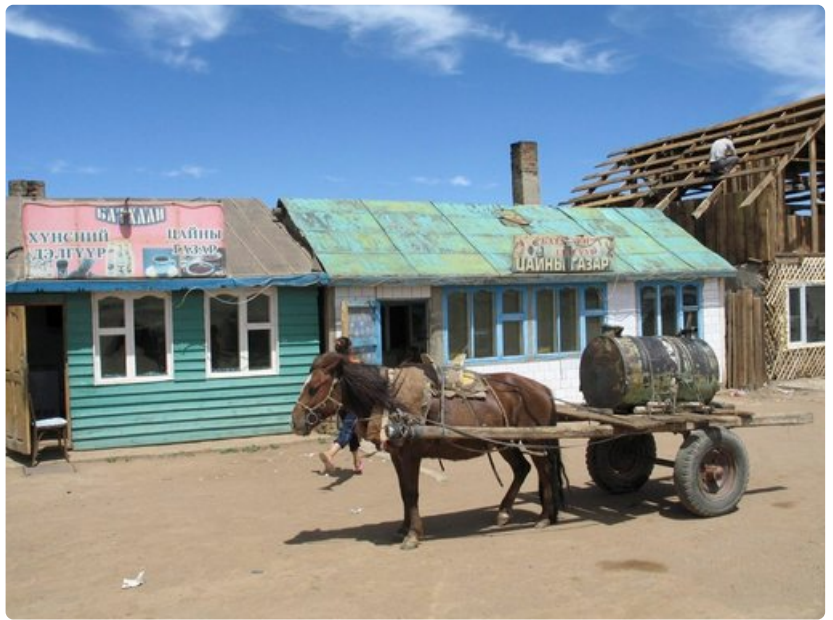
Mongolialaisten tärkein kulkuneuvo on hevonen.