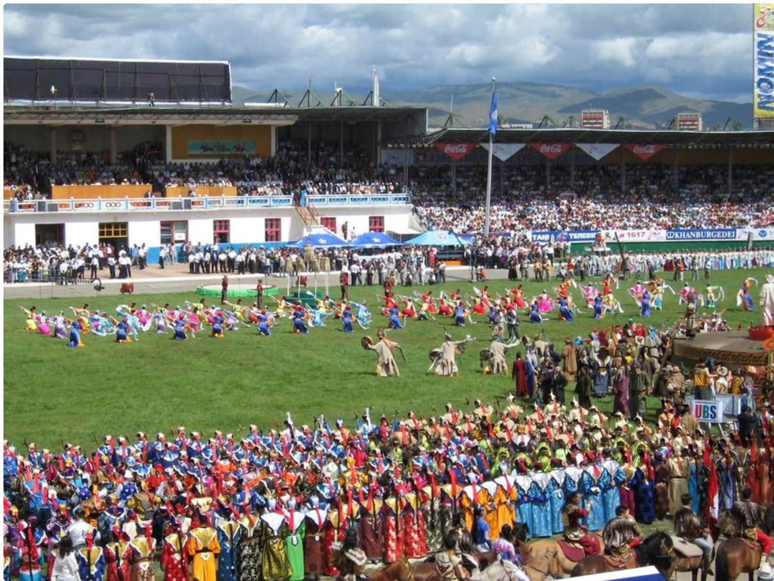
Naadam on Mongolian merkittävin juhla.