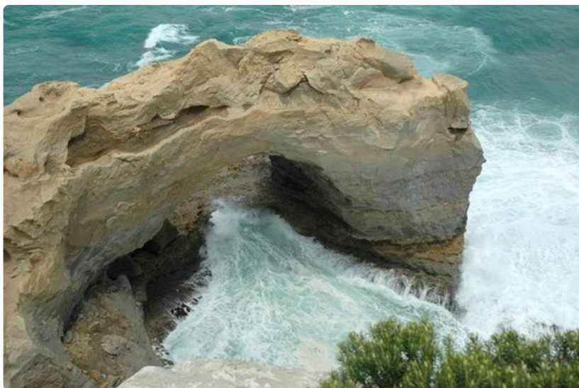
Muutamana kilometrin päästä Port Campbellista löytyy veden kallioon kovertama "neulansilmä".