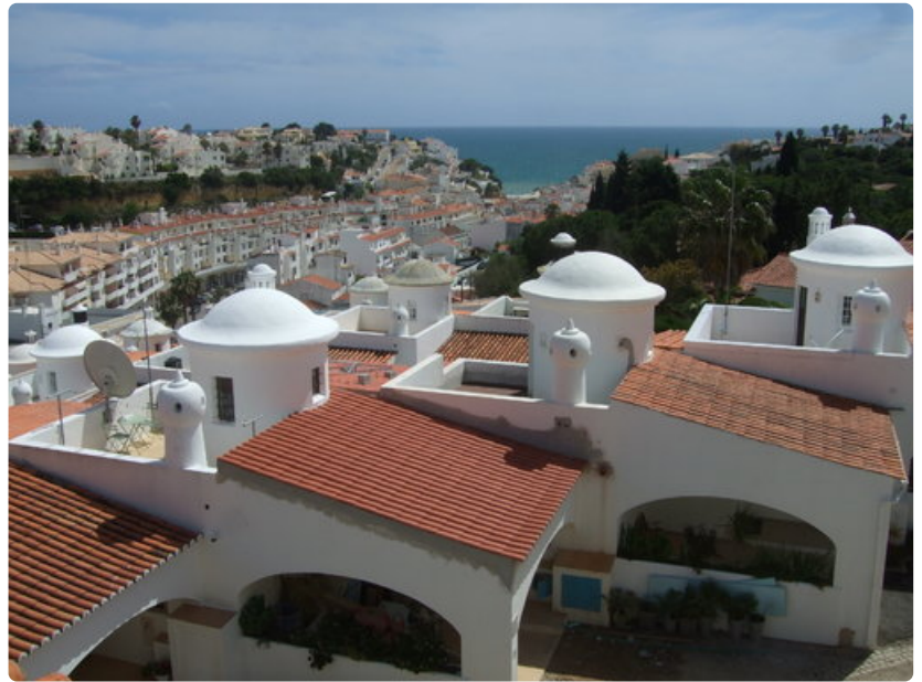
Apartmenton parvekkeelta näkymä Carvoeiron keskustaan. Valkoisissa torneissa on kierreportaat huoneiston ylemmille aurinkoterasseille. Etäällä mainingin vaahtopää lyö kalliohalkeamaan syntyneelle biitsille. *