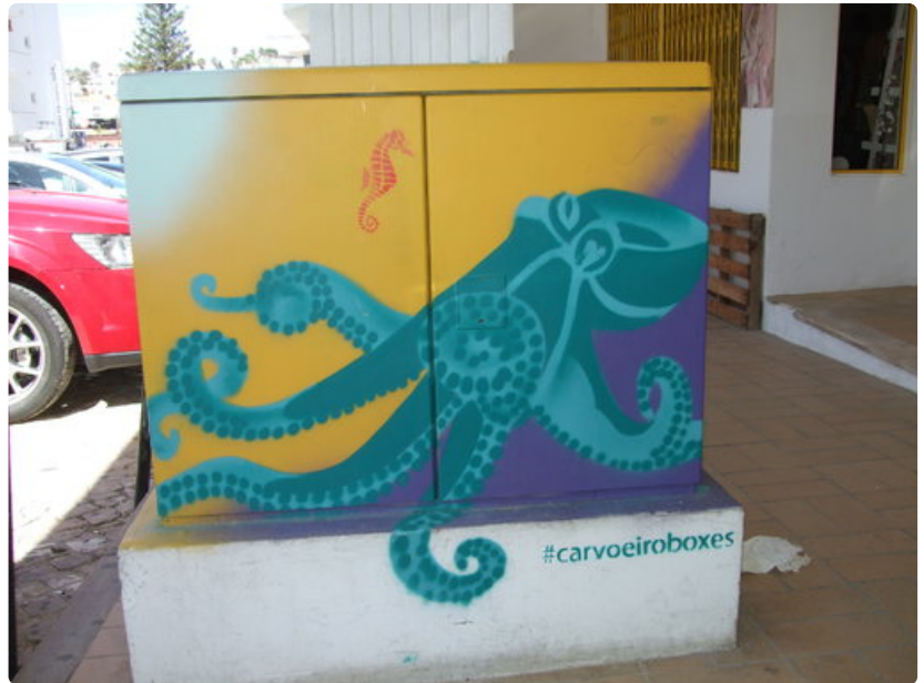
Paikallinen luonto on katutaiteilijoiden ensisijainen inspiraation lähde.