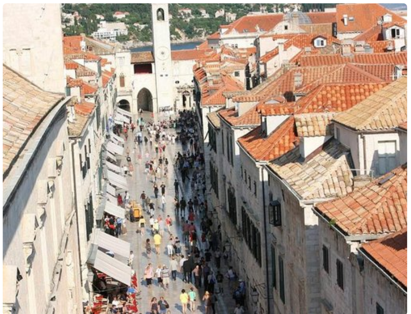
Placa-kävelykatu on Dubrovnikin asukkaille kuin olohuone