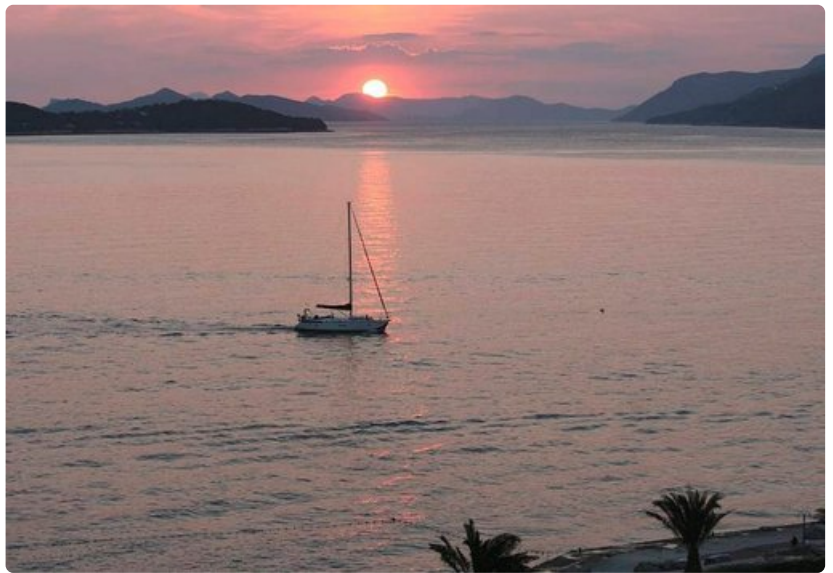
Auringonlasku Hotelli Valamar Presidentin terassilta

Lapadin niemimaan kärjessä on Babin Kukin alue, missä sijaitsevat Valamar-hotellit. Valamar on Kroatian ykkösketju, ja sen brändi on hyvän tason synonyymi. Juuri uudistetun Valamar Dubrovnik Presidentin Hotellin baarista voi nauttia Dalmatian upeimmista auringonlaskuista. Hotelli oli entisen Jugoslavian presidentin, Josep Broz Titon lempipaikka.