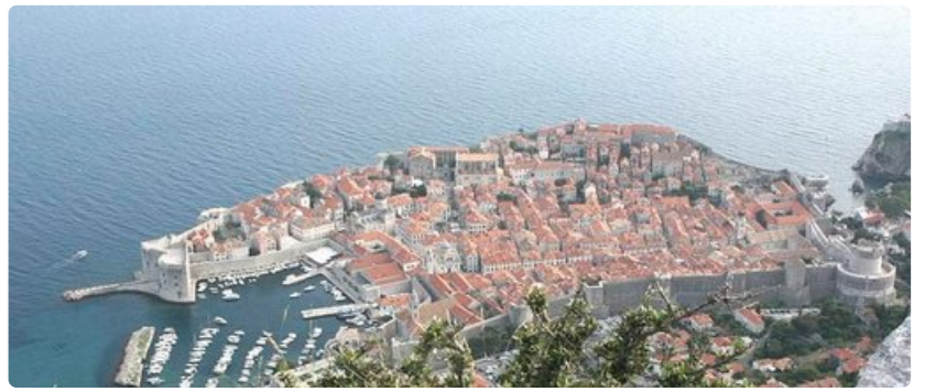
Korkealta Srd-kukkulalta katsoen Dubrovnik on kuin satujen laiva