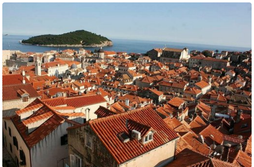
Vanhankaupungin punaiset tiilikatot vaurioituivat sodan aikana 1990-luvulla