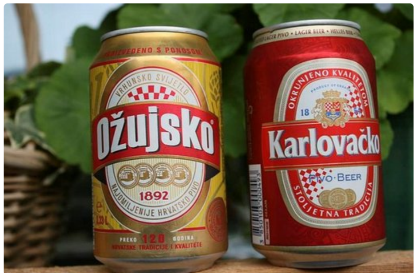
Suosituimmat paikalliset olutmerkit