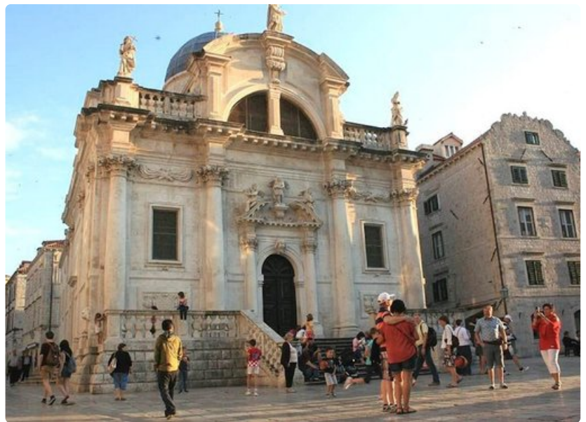
Pyhän Blasiuksen kirkko vanhassakaupungissa. Blasius on Dubrovnik suojeleuspyhimys