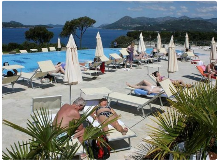
Hotelli Valamar Argocj Babin Kukussa kaupungin liepeillä