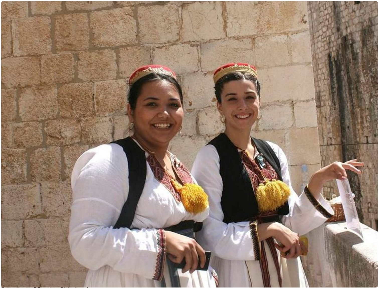
Dalmatian tyttöjä perinteellisissä asuissa