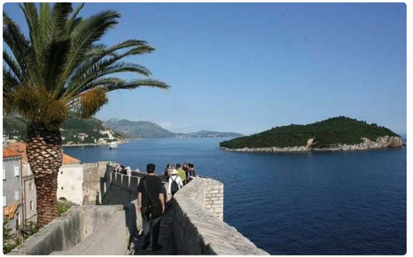
Kaupungin muurilla on hyvät näköalalokrumin saarelle