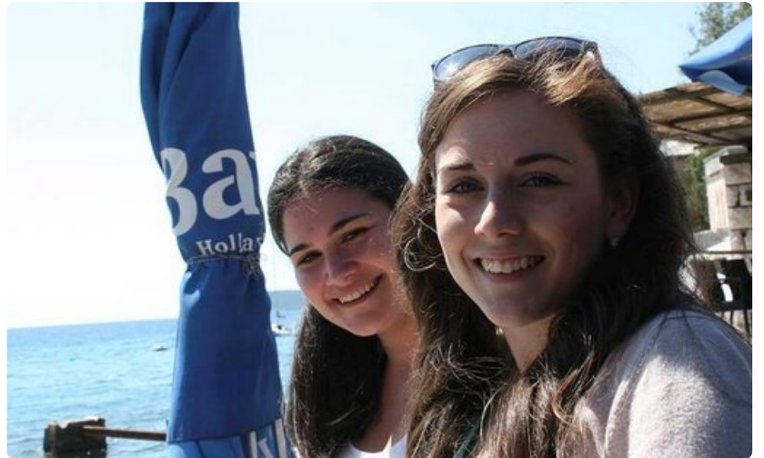
Paikalliset tytöt rentoutuvat Lapadin huimarannalla