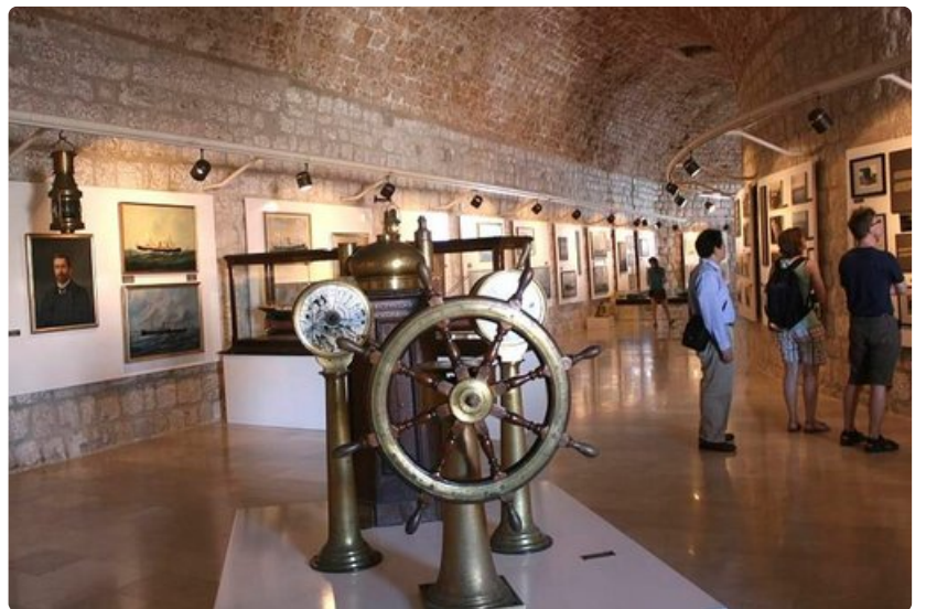
Merimuseo kertoo kaupungin menestyksellisestä merenkulun historia