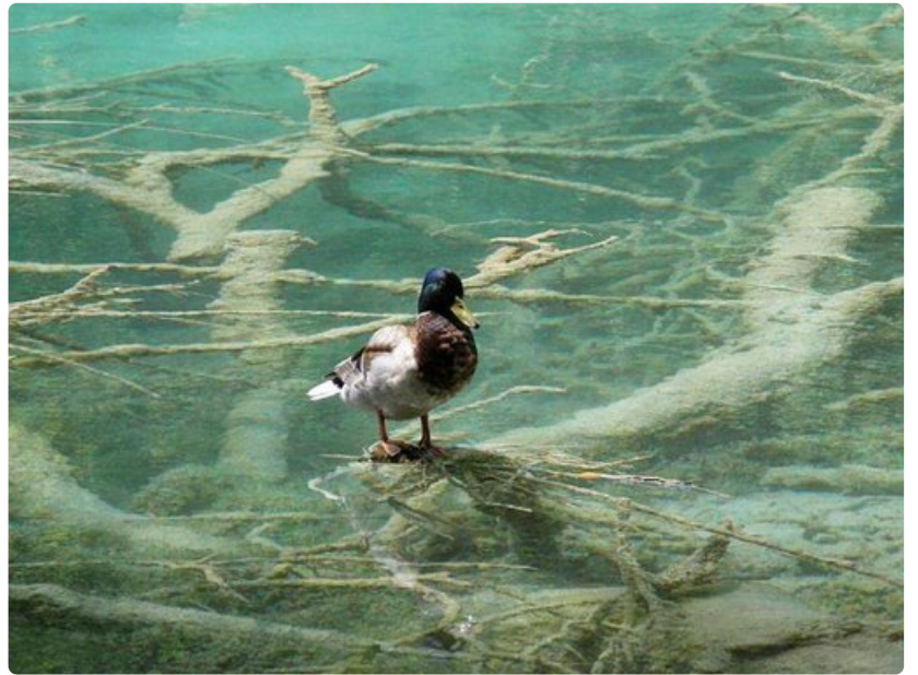
Näyttää kuin vesilinnut seisoisivat vetten päällä.