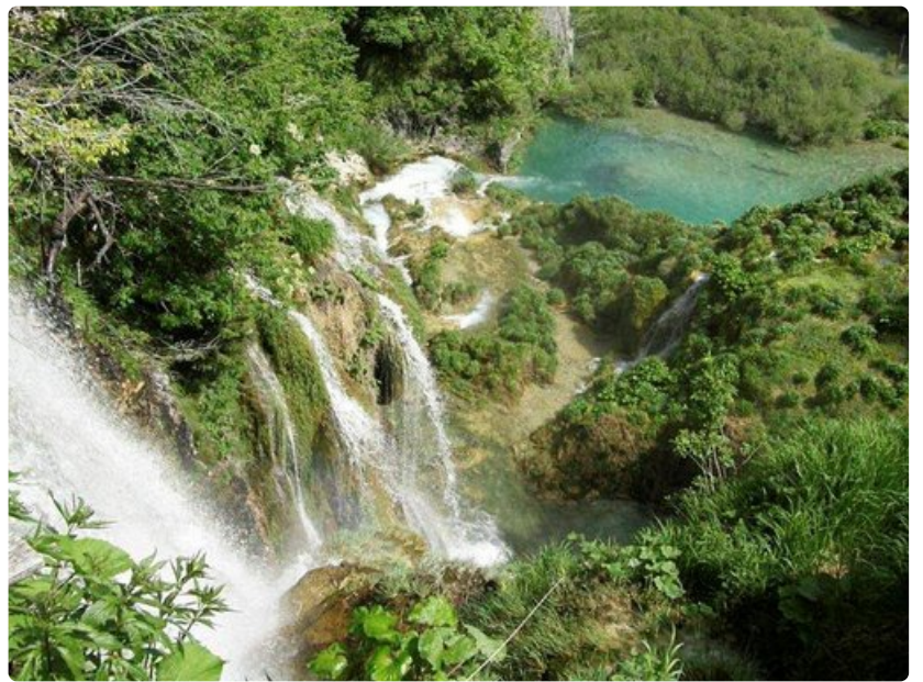
Vesiputoukset muodostavat kauniita altaita järvien väliin.