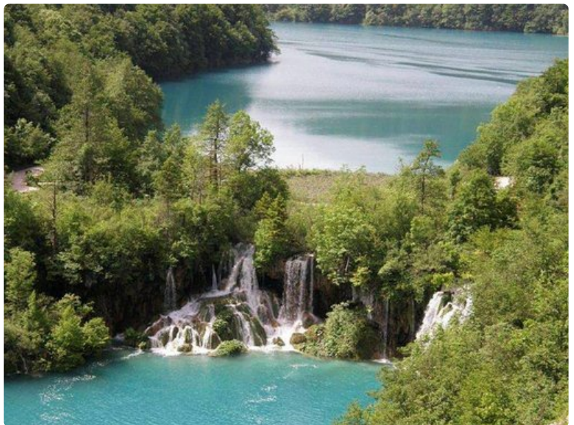
Luonnon omat padot porrastavat vesimassat eri kerroksiin.