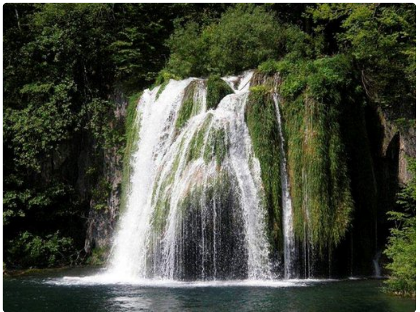
Vierailijan täytyy pidätellä itseään menemästä uimaan putousten alle.