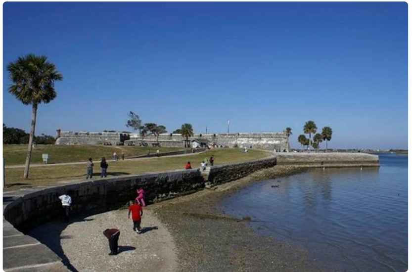
Espanjalaisten 1600-luvulla rakentama Castillo de San Marcosin eli Fort Marionin linnoitus St. Augustinissa.