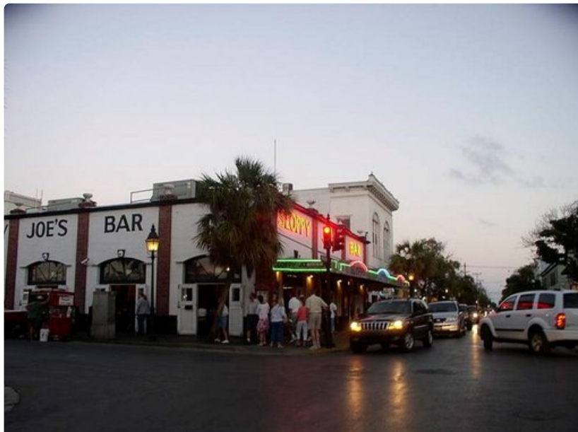
Sloppy Joe's. Hemingway'n "kantabaari". Key West.

Suurin vaaratekijä on hektinen liikenne. Tuloerot ovat huomattavasti suuremmat kuin Suomessa. Siksi matkailijan ei kannata lähteä iltakävelyille ottamatta ensin selvää, onko se seudulla turvallista. Pieniä lapsia on pidettävä jatkuvasti silmällä, tai saattaa itse joutua syytteeseen heitteillejätöstä. Jopa Disney Worldin portilla lapsilta ja heidän huoltajiltaan otetaan sormenjäljet, lapsikaappausten ehkäisemiseksi. Ulkopuoliselle tämä ehkä vaikuttaa vainoharhaisuudelta. Yleisesti ottaen Floridassa on turvallista matkailla.