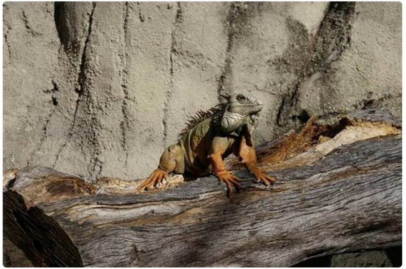
Iguaanit ovat sopeutuneet liiankin hyvin Etelä-Floridan luontoon.