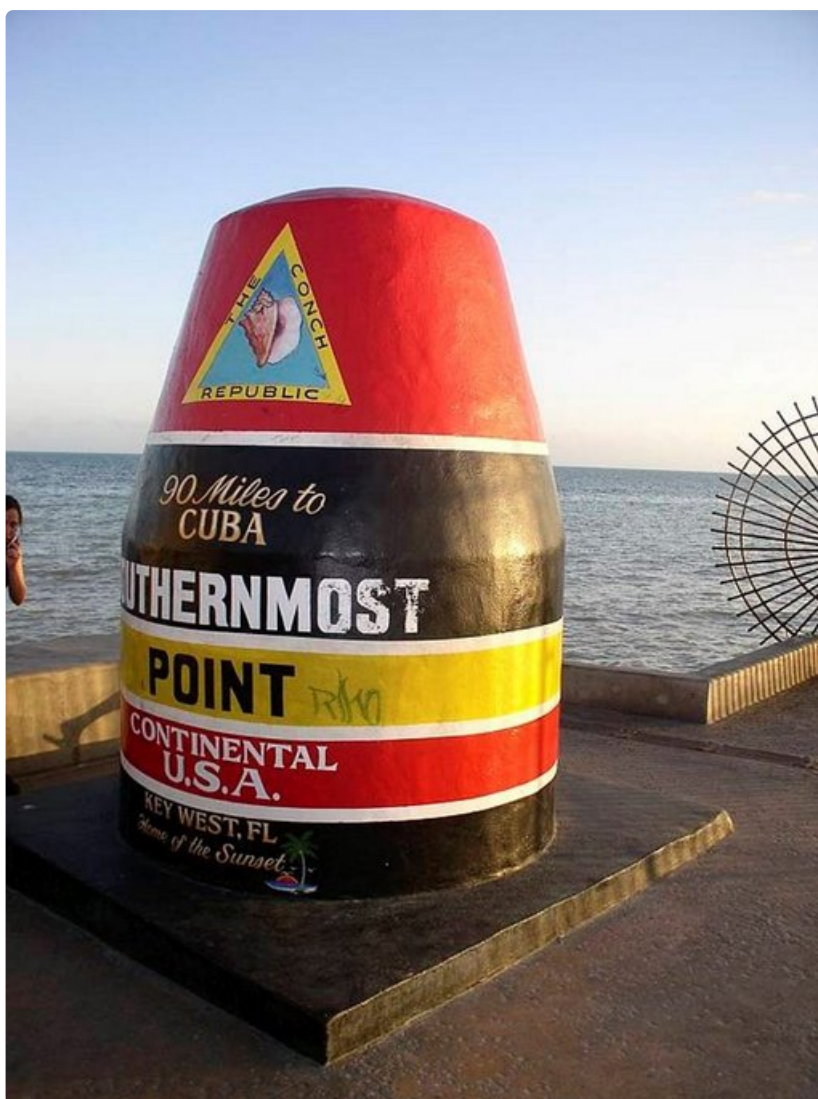
Tähän päättyy ykköstie: 145 km Havanaan, 216 km Miamiin.