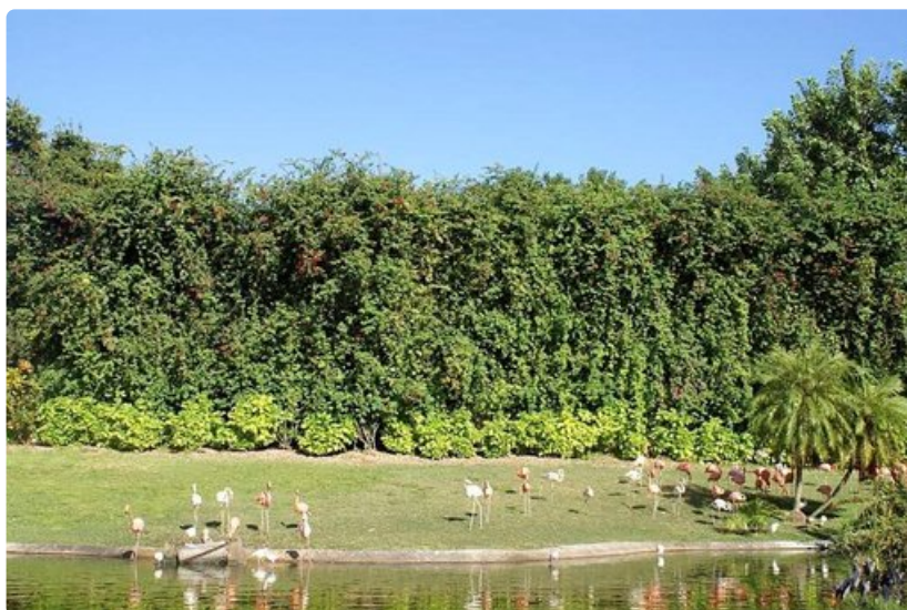
Everglades on myös lintuparatiisi. Nimensä veroinen Flamingon vierailukeskus.