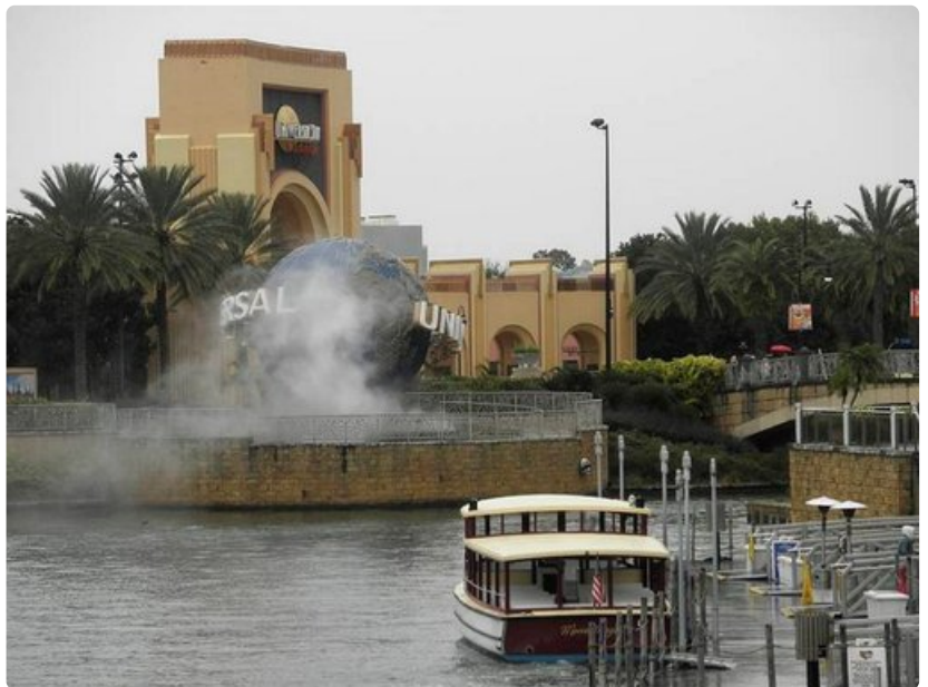
Vuoden koleimpana päivänä tammikuussa ei Orlandon teemapuistoissakaan ole jonoja (Universal Studios).