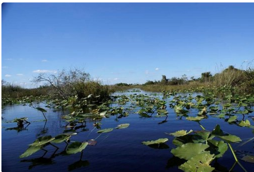
Melontaväylä. Loxahatchee Wildlife Refuge.