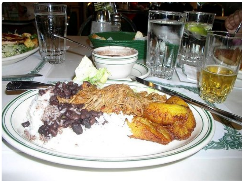
Versaillesin ropa viejan vuoksi ajaa helposti muutaman kymmenen kilometriä Little Havanaan.

Vuonna 2011 Floridassa esiintyi viisi hurrikaaniksi luokiteltavaa myrskyä. Parikymmentä vuotta sitten (23.8.1992) hurrikaani Andrew riepotteli Floridan ja Louisianan rannikkoja sekä Bahamasaaria kylväen valtavaa tuhoa. Myrskyn lasketaan aiheuttaneen 55 kuolemantapausta.