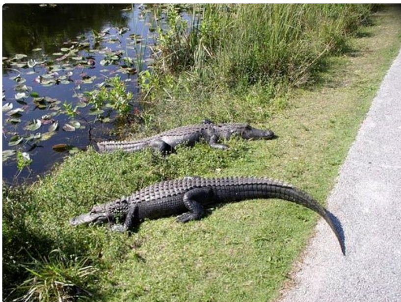
Alligaattorit loikoilevat tiellä Share Valleyn osassa kansallispuistoa