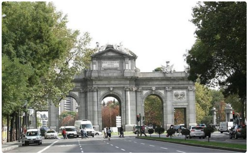
Alcalan portti on yksi Madridin maamerkeistä.