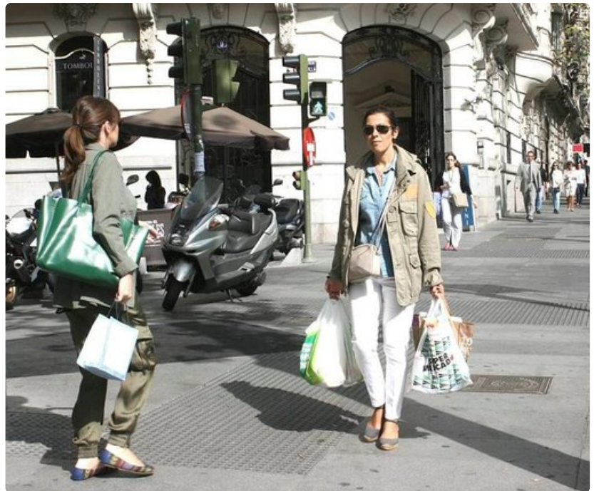
Serrano on ehdoton shoppailukatu.