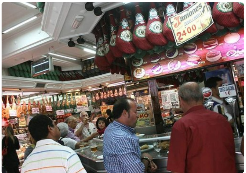
Museo del Jamón -ketjun baarit tarjoavat runsaasti kinkkulajeja.