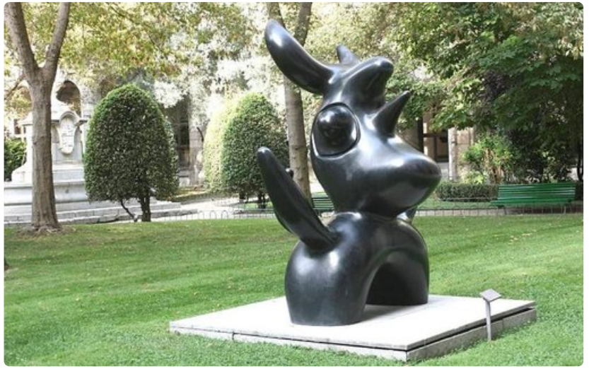
Taidetarjonta on todella laaja. Joan Mirón veistoksia löytyy Museo Reina Sofian puutarhasta.