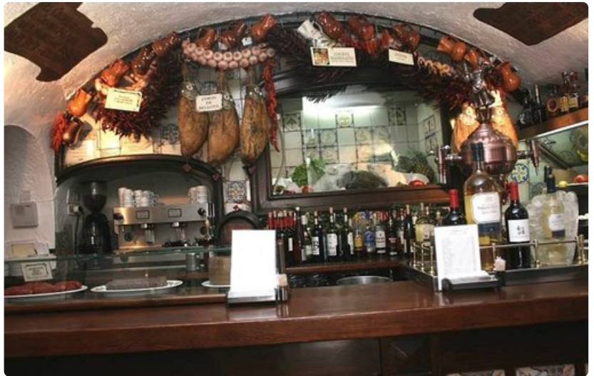
Suurin osa Madridin kuppiloista ja tavernoista on hyvin persoonallisia.