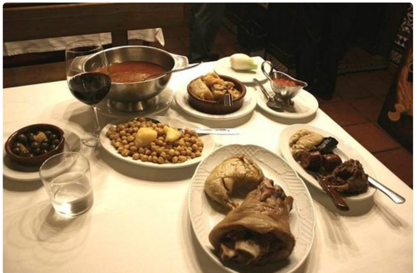
Cosido Madrileño on tuhti pataruoka.