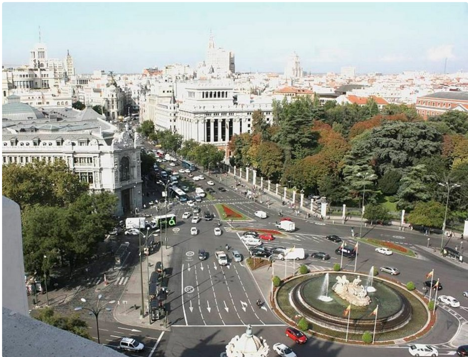
Huikemat näkymät Alacala-pääkadulle ja Cibeles aukiolla.