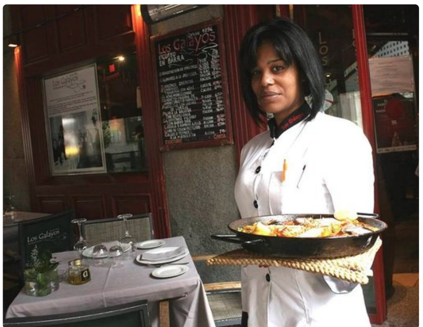
Ravintola Los Galayos Plaza Mayor -aukiolla on perinteinen ruokapaikka.