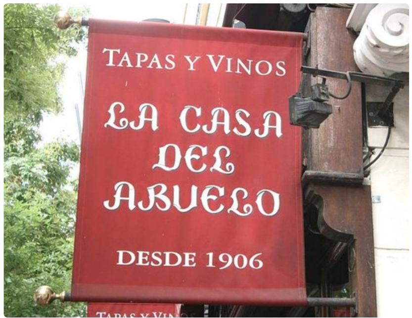
Viiniä ja tapaksia Casa del Abuelossa (isoisän talossa) Goya-kadulla.