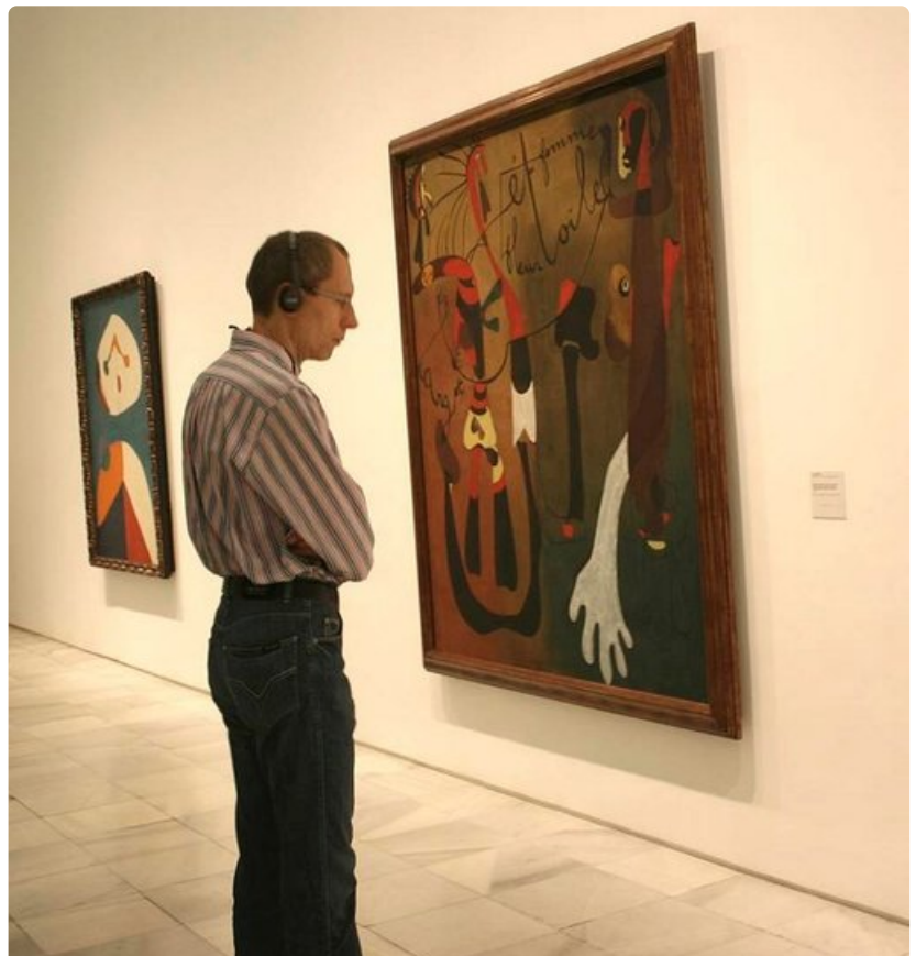
Pablo Picasson kuuluisin taulu La Guernica on nähtävillä Reina Sofia -taidemuseossa.