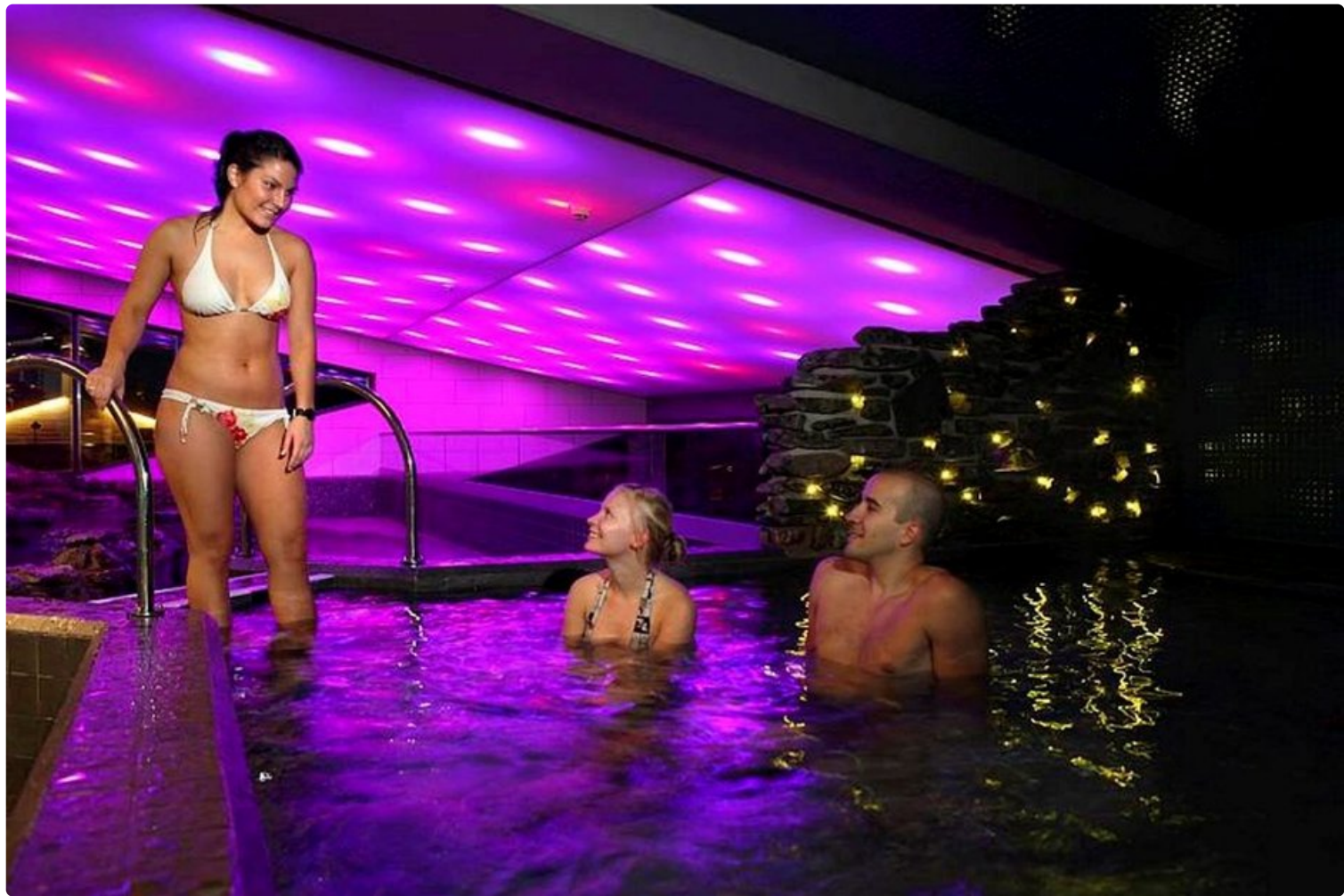
Hyvinvointimatkoja tehdään kotimaahan ja ulkomaille. Kuvassa hyvinvointilomalaisia Levin kylpylässä.