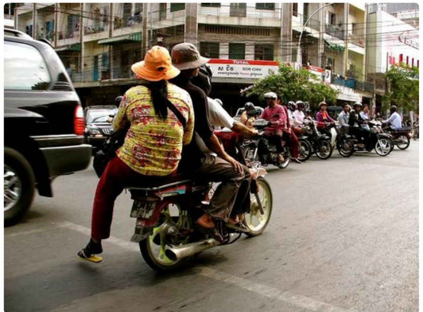
Skootterikyty on Kambodžan ylivoimaisesti suosituin liikkumismuoto.