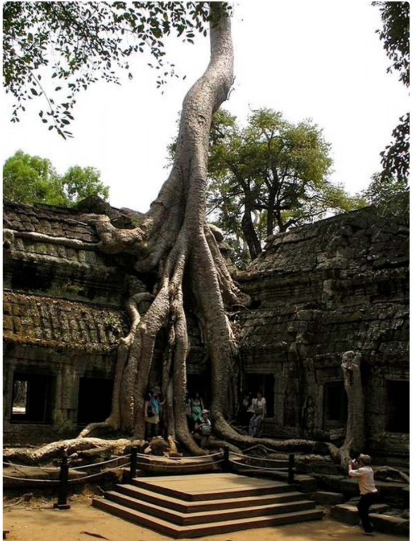
Viidakko söi Angkorin tempelit sisäänsä, kunnes ne löydettiin uudelleen vuonna 1864.