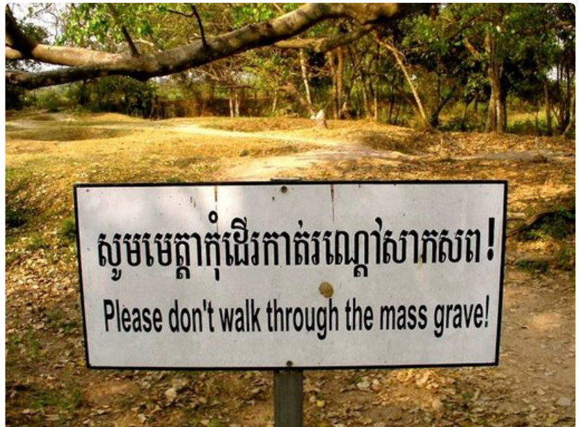
Choeung Ek, Kuoleman kentät. Phnom Penhin liepeillä sijaitsevalla alueella on yli 17 000 ihmisen joukkohaudat.