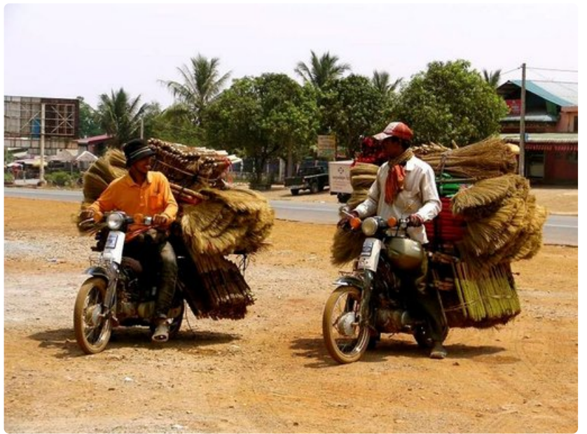
Kambodžassa kaikki liikkuu prätkillä - kokonaisista perheistä muuttokuormiin.