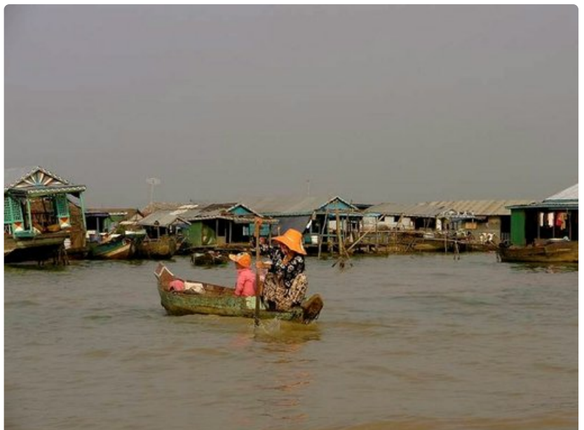
Elämää Tonle Sapin järvellä sijaitsevilla Kelluvissa kylissä.