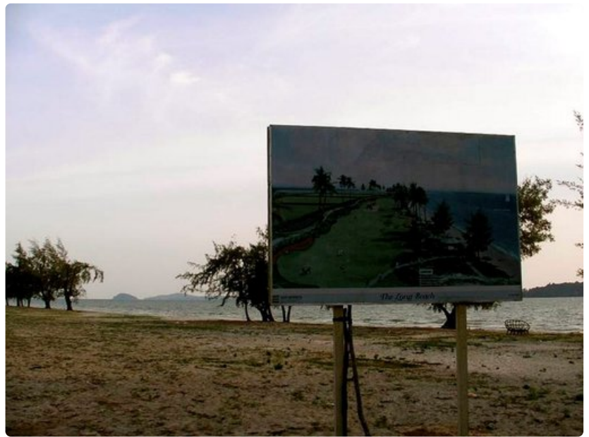
Otresin toistaiseksi tyhjiille rannoille on suunnitelmassa matkailukeskittymiä.

Kambodža kuitenkin muuttuu silmissä. Otresin puolityhjiille rannoille on jo kaavoitettu hulppeita hotelleja ja nurmialueita. Se ei sinällään kuulosta pahalta. Lisääntyvä matkailu on yksi keino nostaa Kambodža köyhyydestä ja parantaa paikallisten elinoloja. Matkailulla on kuitenkin myös vaaransa. On kysymyksiä, joita sekä reissaajien että kambodžalaisten tulisi kysyä itseltään.