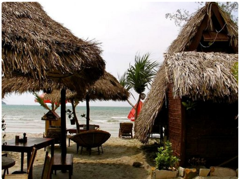
Sihanoukvillen liepeiltä löytyy hiljaisia bungaloweja ja kilometritolkulla hiekkarantaa.