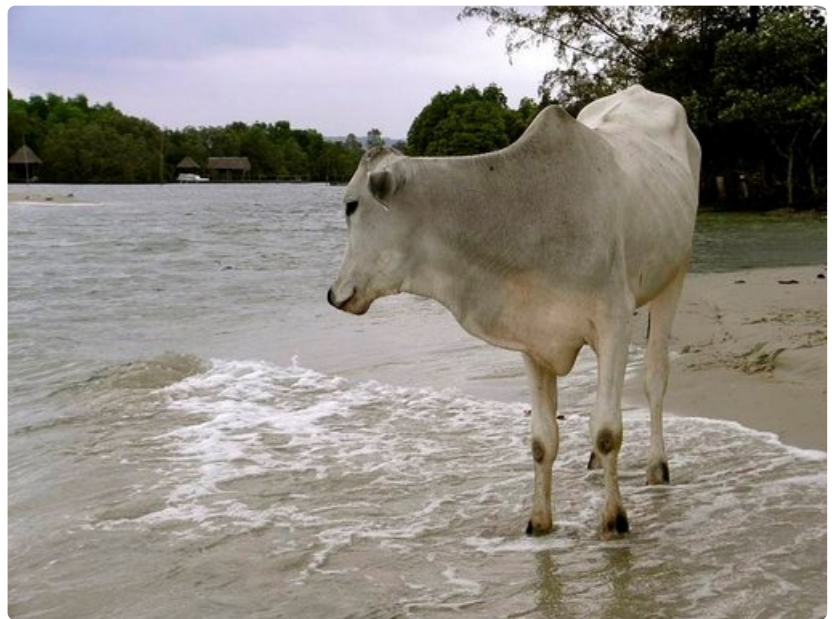
Kulkuri-lehmä autiolla rannalla.