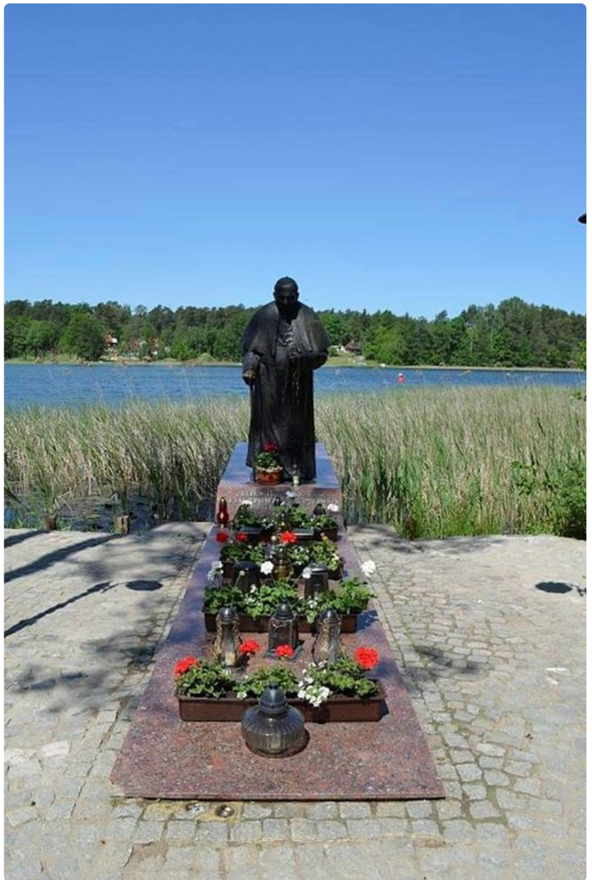
Puolalaisyntyinen paavi Johannes Paavali II vieraili Puolassa ja Augustówin alueella 1999.