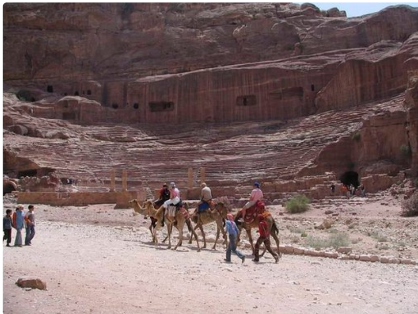
Kameliratsastus on suosittua. Petraan tutustuttaessa se on helpoin tapa liikkua kohteesta toiseen.