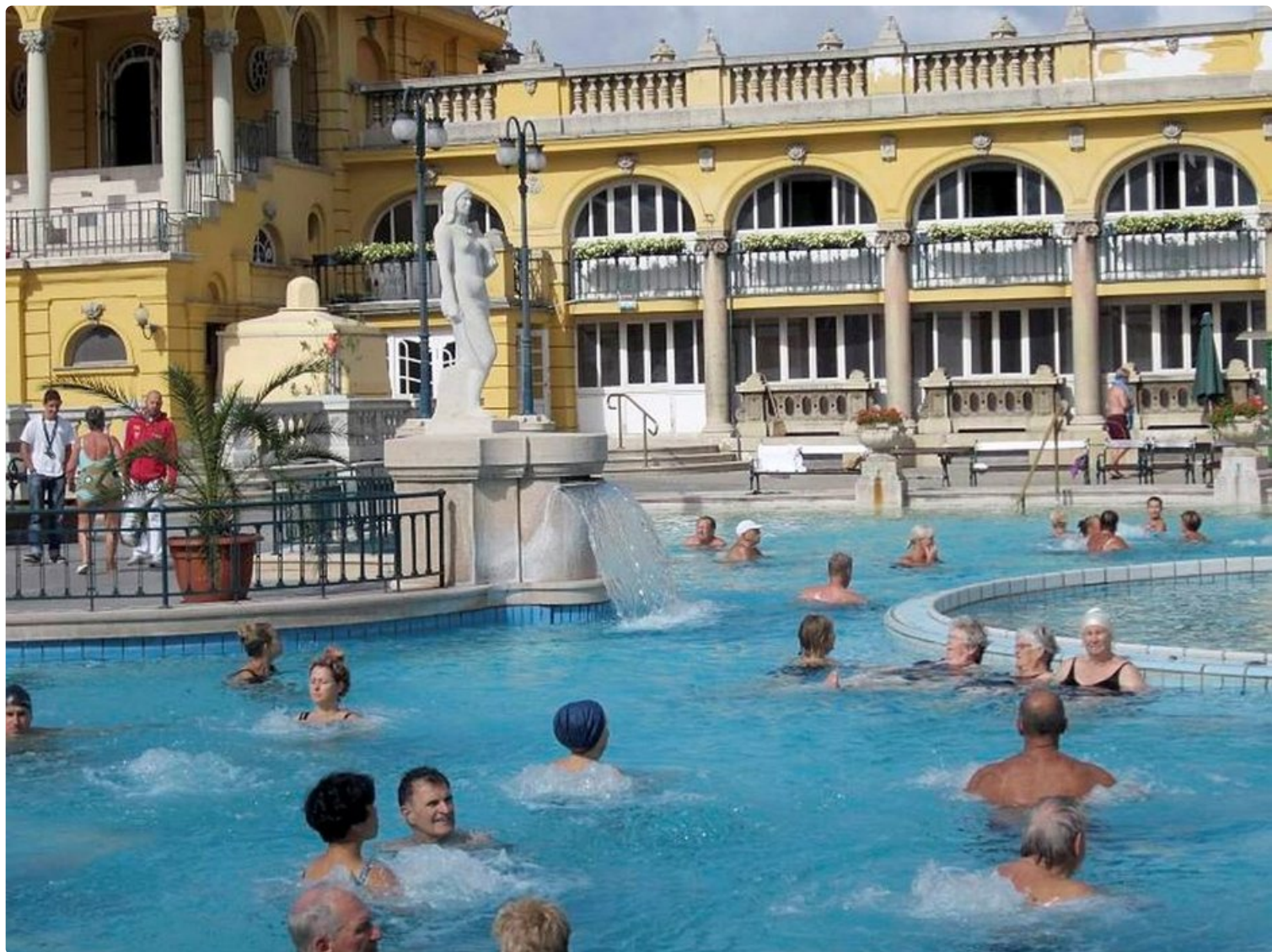
Széchenyin kylpylän ulkoallas houkuttelee varttuneempaa väkeä.