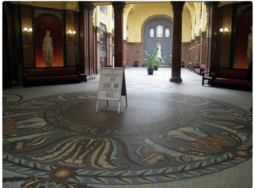
Gellertin kylpylän sisäntulo.