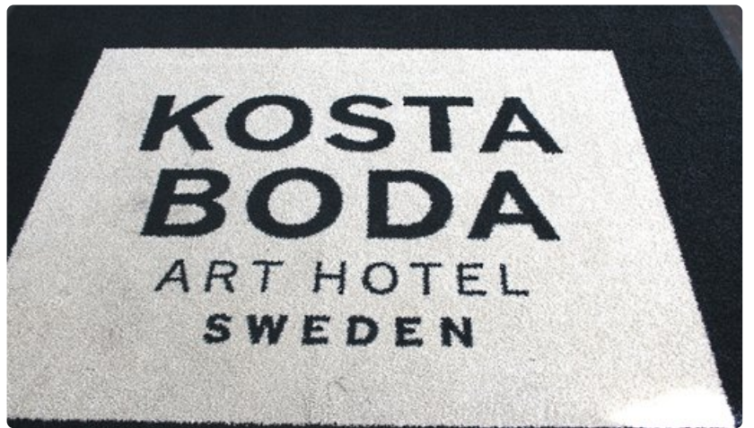
Taidehotelli Kosta Boda on saanut runsaasti kansainvälistä tunnustusta