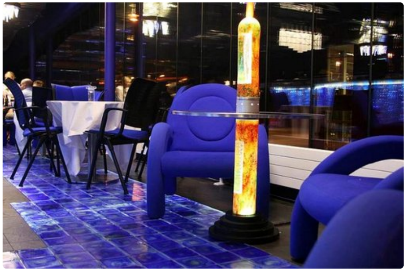
Art-hotellin sininen baari on tehty lasista.