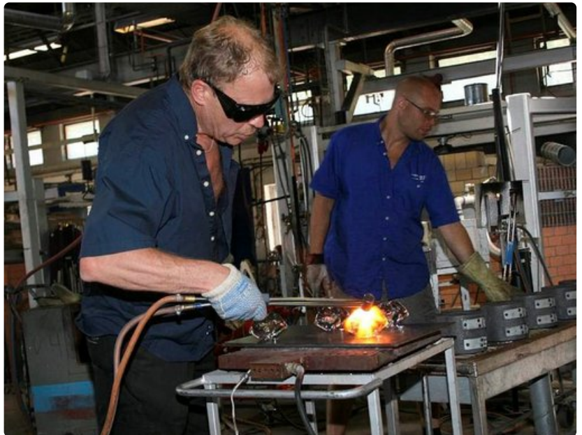
Lasinvalmistusta Åforsin lasitehtaalla.