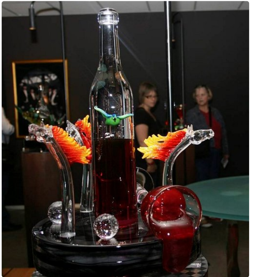
Taiteilija Kjell Engmanin käsialaa.