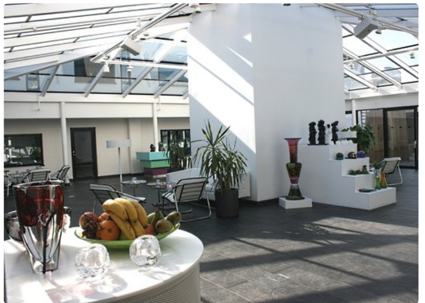
Kosta boda Art hotellin sisäpiha