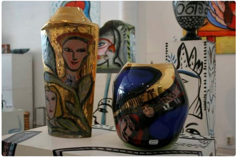
Lasitaidetta Åforsin lasitehtaalla.