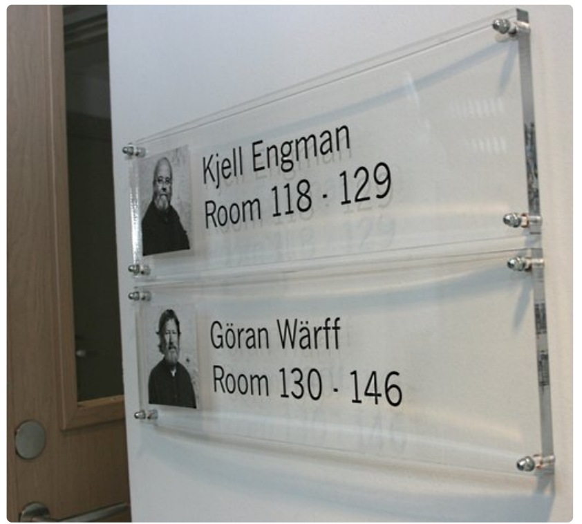
Kaikki hotellihuoneet ovat taitelijoiden sisustamia