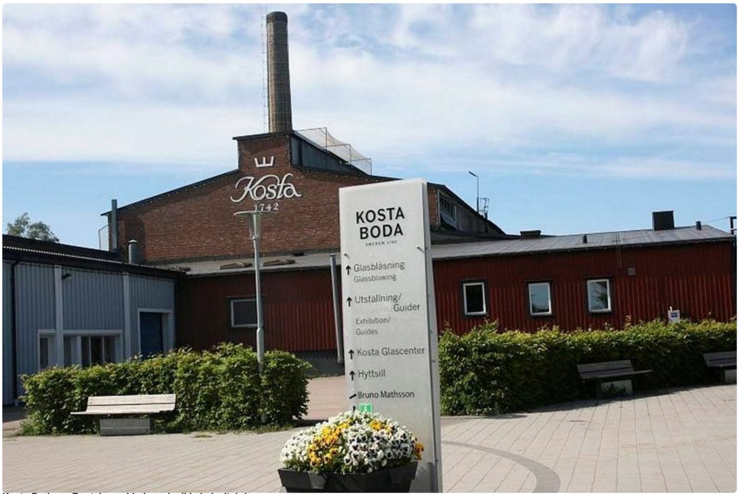
Kosta Boda on Ruotsin vanhin ja maineikkain lasitehdas.