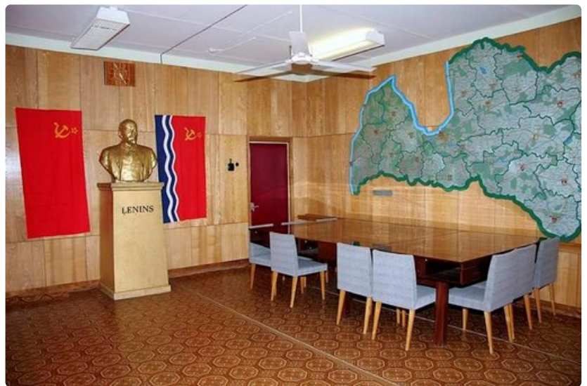
Jotta kokoushuoneen seinälle saatiin Latvian suurikokoinen kartta, se piti ryöväätä maatalousministeriöstä. Tosin se on maan kolhoosikartta, josta löytyy sellaisia kolhoosien nimiä kuten "Leninin Kipinä" ja "Punainen Nuoli".