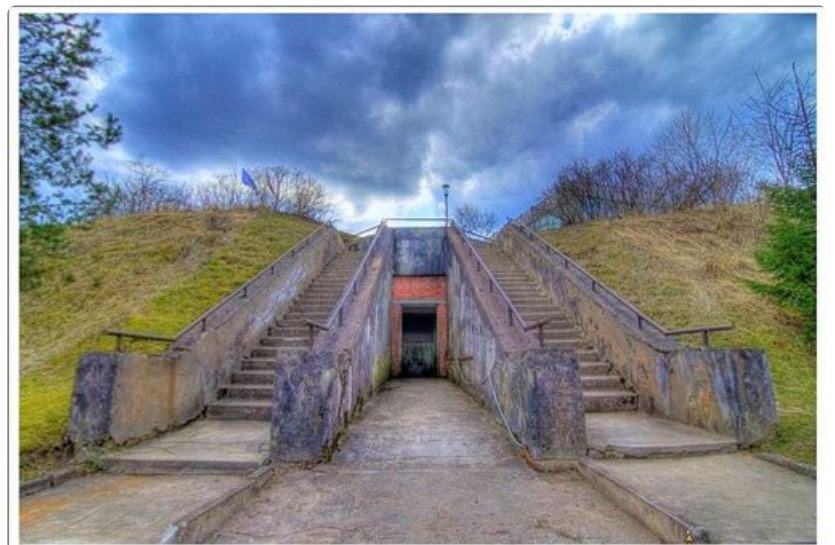
Bunkkerin huolto-ovet olivat neuvostoaikana nähneet vain harvat ja valitut - mutta kaiketi se oli tuttu myös Naton ottamia ilmavakoilukuvia tarkastelleille.