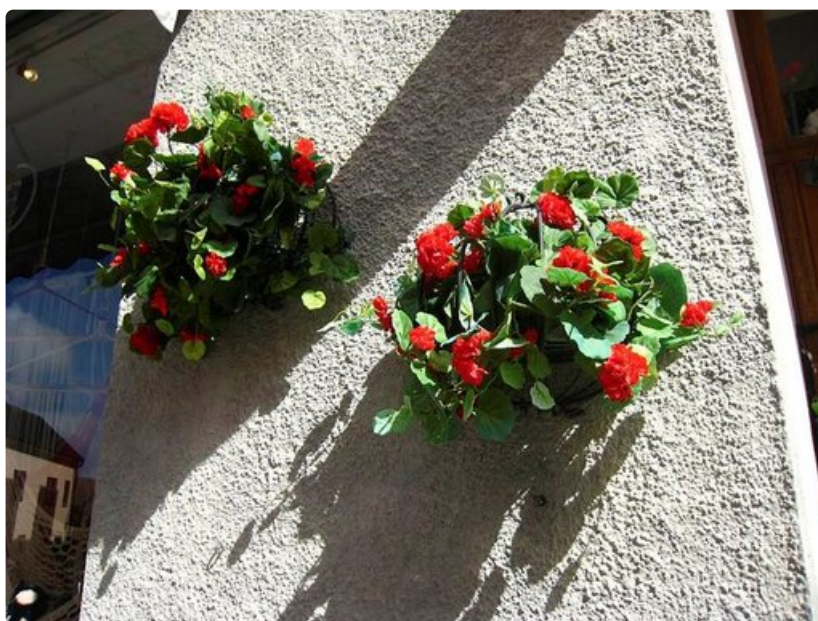
Visby on kukkasten kaupunki.