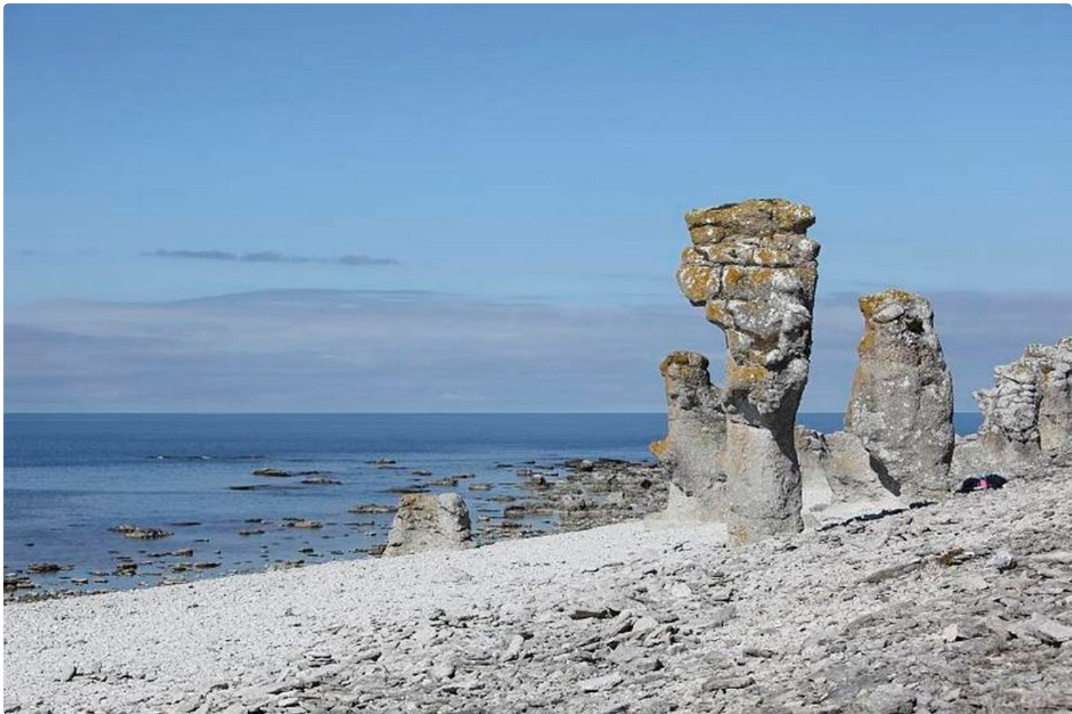
Fårön raukit ovat kuin Pääsiäissaaren Moait pienoiskoossa.