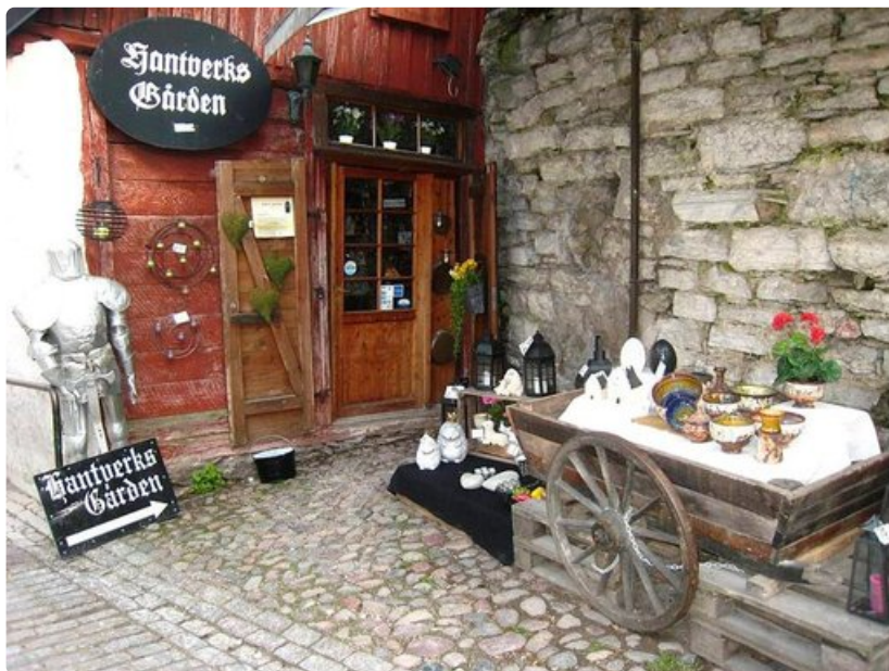
Visbyn Vanhassakaupungissa on viehättäviä pieniä käsityöliikkeitä.

Kolea, mutta aurinkoinen aamu aukeaa vanhan hansakaupungin Visbyn kaduilla. Ruotsin aurinkoisin kaupunki on alkukesästä parhaimmillaan, kun luonto alkaa näyttää vehreyttään ja kukat ovat vasta puhkeamassa. Keväällä tai alkusyksyllä koetusta seesteisestä rauhasta voi vain haaveilla kiireisimpinä kesäkuukausina.