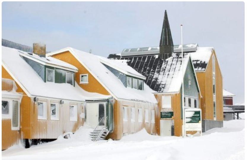
Mikään rakennus ei ole Grönlannissa suuri. Ohessa maan taidegalleria.