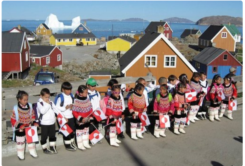
Inuittikulttuuri on vahvasti edelleen läsnä esimerkiksi lasten vaatetuksessa.