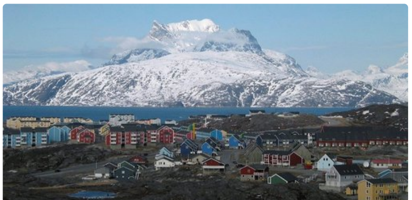
Nuukin takana kohoavat jylhät vuoret.