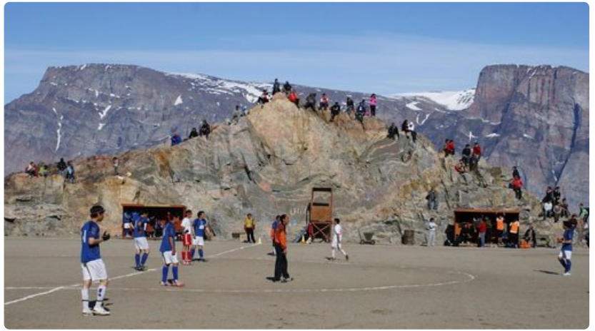
Grönlannissa ei ole paljon tasaisia paikkoja, joten kaikki tila käytetään hyväksi.

Valtiomuoto: Tanskalle kuuluva itsehallinnollinen alue Pääkaupunki: Nuuk Pinta-ala: 2 166 086 km 2 Asukasluku: n. 57 000 Kieli: grönlanti, tanska Valuutta: Tanskan kruunu, DKK, 1 euro = 7,4 DKK Uskonto: Luterilaisuus Ilmasto: Arktinen ilmasto. 80% maasta on jään peitossa Aikaero Suomeen: -3 tuntia