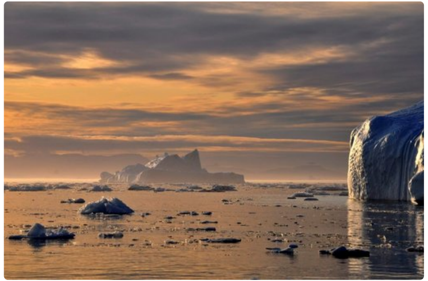
Vuodenaajasta riippumatta rannikolla ajelehtii jäävuoria.