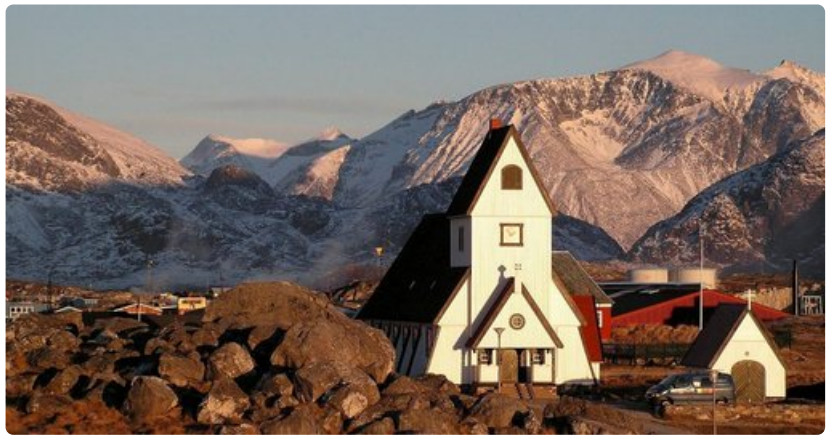
Syvällä Grönlannissa voi törmätä äärettömän kauniisiin kohteisiin.