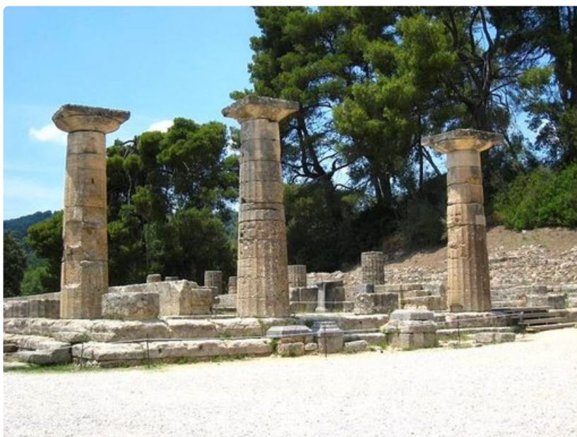
Heran temppelin raunioiden edustalla Olympiassa sytytetään olympiatuli joka neljäs vuosi.