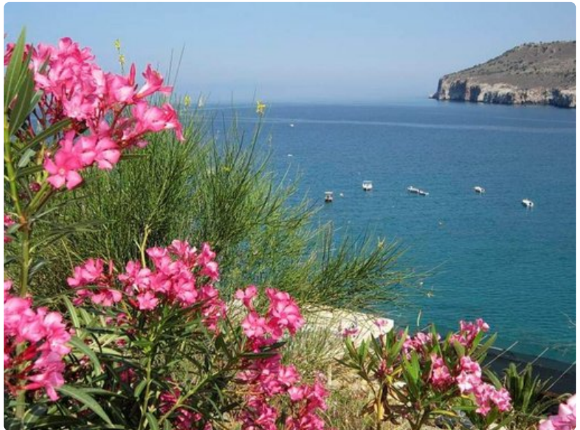
Diroksen tippukiviulolien ulkopuolella oleva maisema on harmoninen ja rauhoittava.