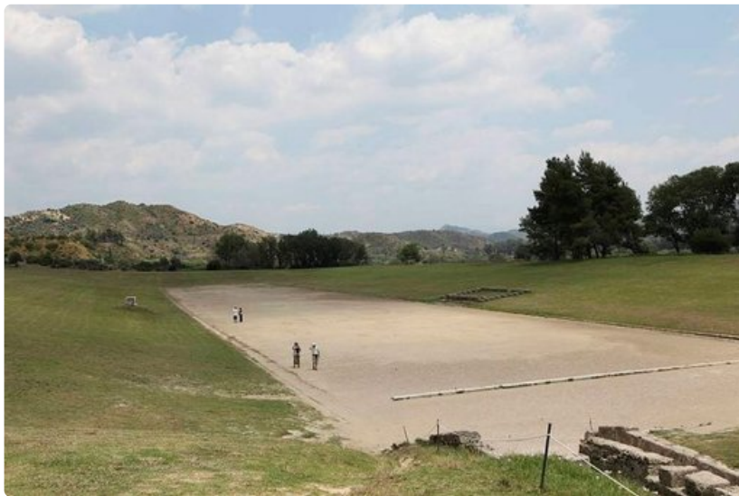
Olympian stadionilla alkuun lajina oli juoksu, myöhemmin viisiottelu.