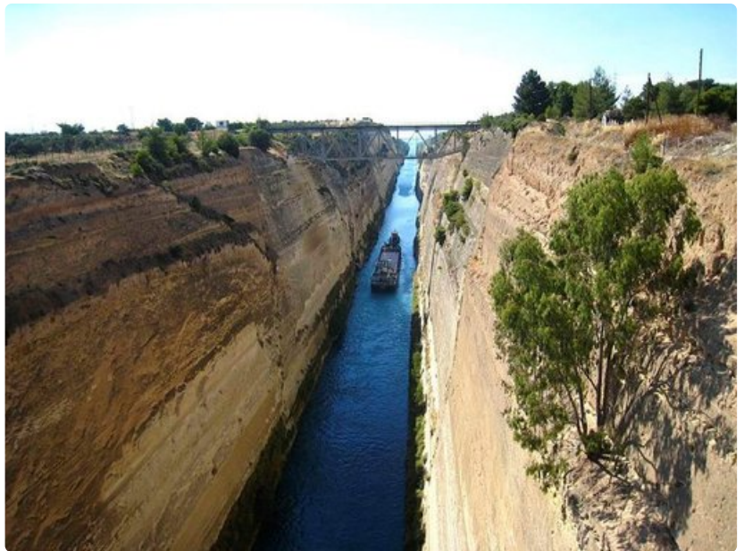
Korintin kanavaa liikennöivät nykyisin turistilaivat ja paikalliset veneet. Isot alukset joutuvat kiertämään niemimaan, sillä kanava on vain 27 metriä leveä.