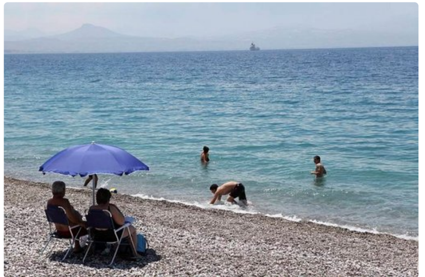
Loutrakin pikkukiviranta on kaksi kilometriä pitkä. Uimakengät helpottavat rantaelämää.