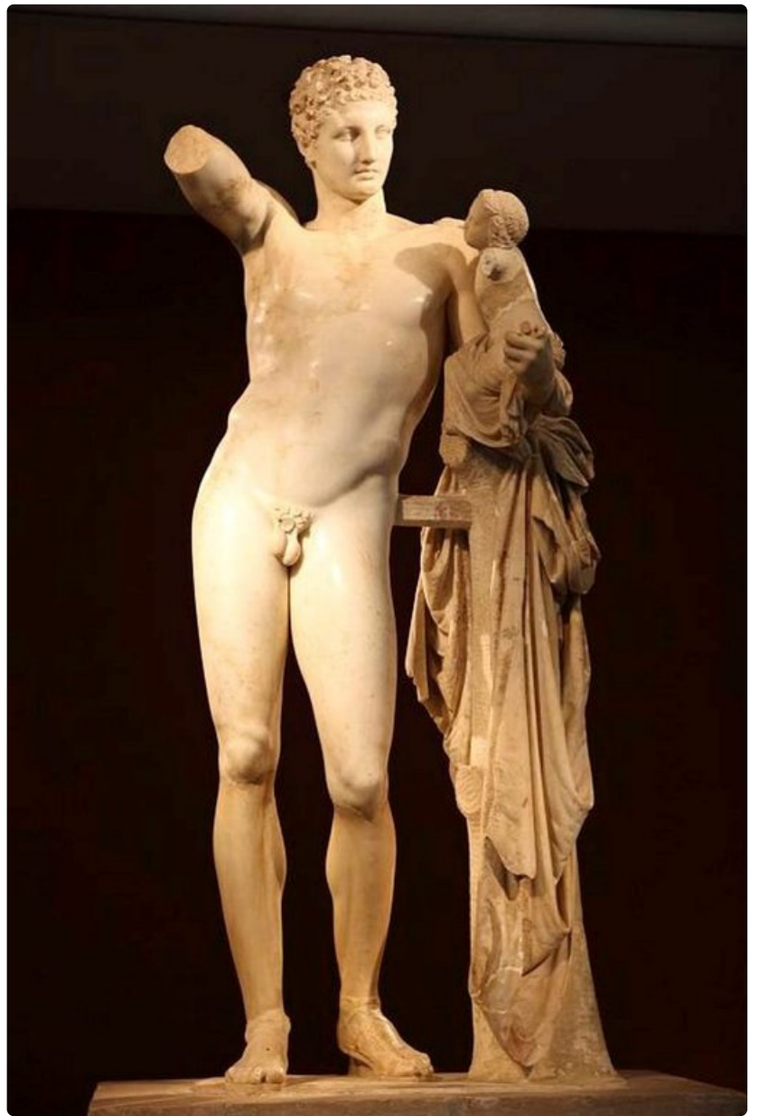
Hermes oli kreikkalaisessa mytologiassa jumalten sanansaattaja.