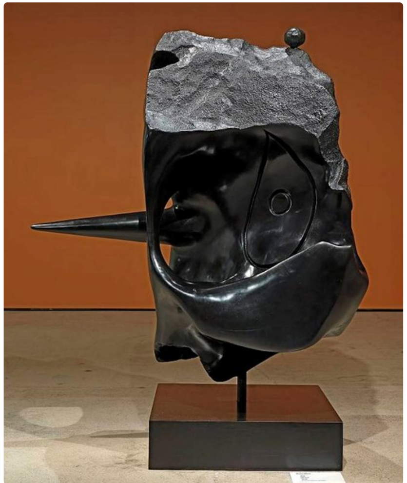
Pää, 1974.