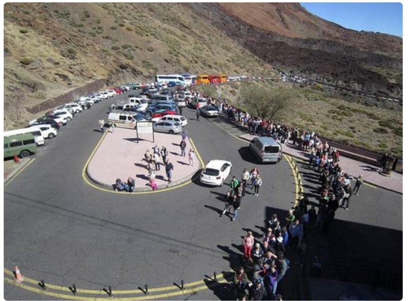
Aurinkoisena päivänä Teiden hisille voi muodostua tuntien jonot.