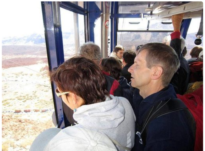
Isää ja tyttärtä ei nousu pelottanut, mutta saksalaismies alkoi voida pahoin.