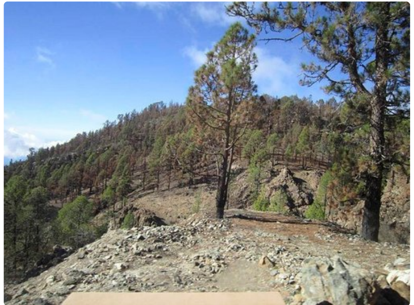
Lohduton näky vielä vuodenvaihteessa, utta kanarianmänty on sinnikäs puu ja aloittaa uuden kasvun metsäpalon jälkeenkin.