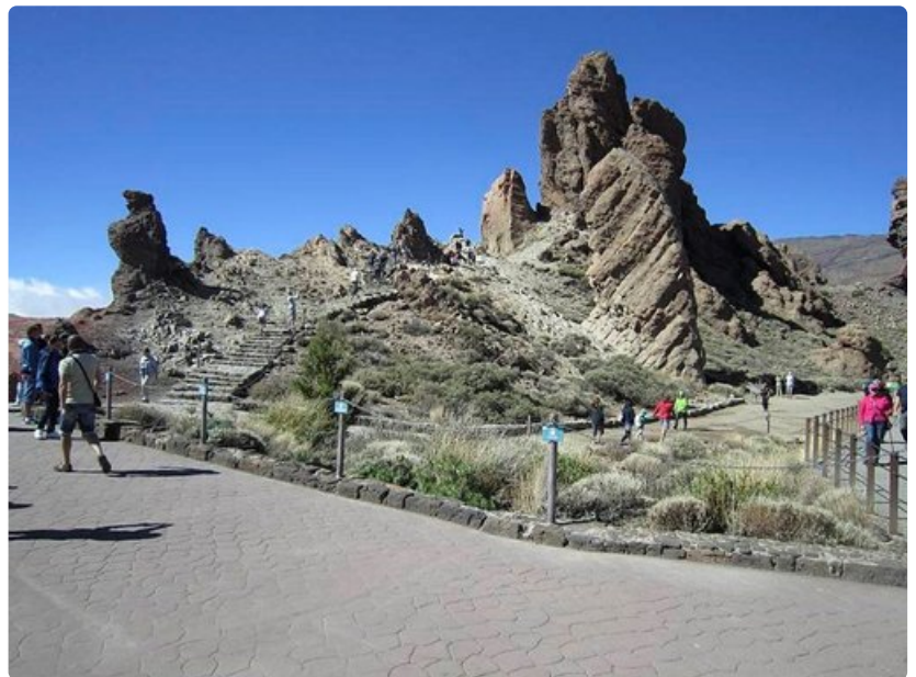
Teneriffan saari nousi merestä tulivuorenpurkauksen seurauksena 11 miljoonaa vuotta sitten.

Kahdeksan vuotta sitten Teneriffalla varoitettiin purkauksesta, sitä edelsi muutama heikko maanjäristys. Myös Teiden yhdestä kraaterista mitattiin suurentuneita kaasupäästöjä ja sen perusteella jotkut ennustivat suurta purkausta. Vuonna 2005 varoitus poistettiin ja nyt purkauksia ei tutkijoiden mukaan ole odotettavissa lähitulevaisuudessa.