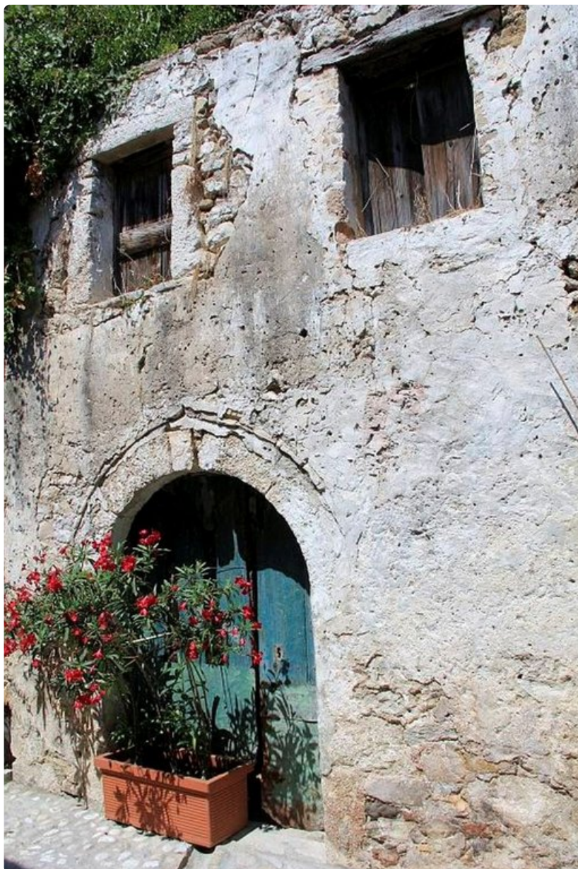
Sata vuotta sitten oliivitehtaan aasit pidettiin alhaalla tallissa, paimijatytöt asuivat yläkerrassa.

Idyllinen postikorttimaisema viehätti niin, että melkein henkeä salpasi. Siihen tietenkäin vaikutti myös kova helle ja kapuaminen pitkin "aasin polkua" eli oikotietä ylös hotelliin uuvuttavassa kuumuudessa. Paikalliset kertoivat, ettei lämpötila ollut noussut yli 40 asteen, joskin lähtöpäivänämme sekin oli luvassa.