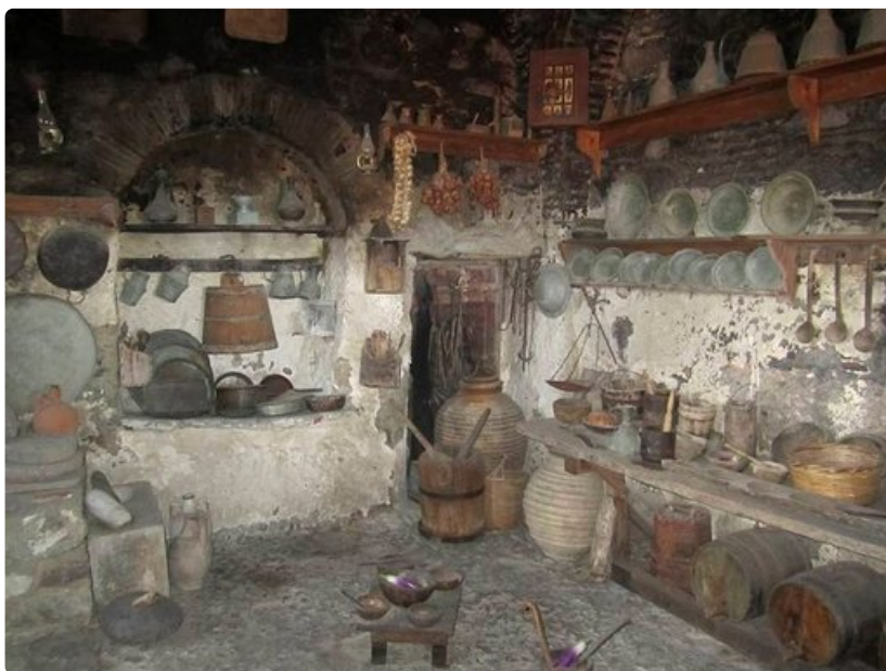
Munkkien elo korkeuksissa on ollut askeettista, kuten luostarimuseon keittiöstä huomaa.