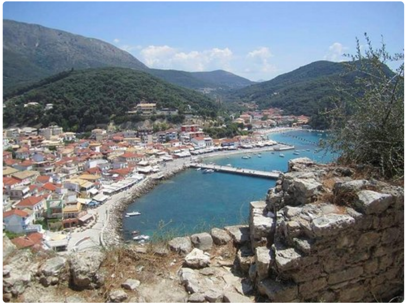
Kaupungin linnavuorelta Parga esittäytyy parhaimmillaan.

Pargasta pääsee veneretkille myös Paxoksen ja Antipaxoksen saarille sekä Korfulle, josta on lyhyt loikka Albanian Sarandaan. Valitsimme bussivaihtoehdon mantereen kautta ja rajalle oli kolmen tunnin ajo. Tuntui hieman oudolta, kun ennen niin suljetun maan nykyiset rajamuodollisuudet olivat olemattomat. Ei edes passeja tarkistettu. Unettava matka sujui Albanian puolella kuumaisessa, lähes erämaamaisemassa eikä asutusta saati ihmisiä näkynyt tien varrella. Muutama vuohi ja pari hylättyä kommunistiajan vahtibunkkeria tuijottivat kulkijoita.