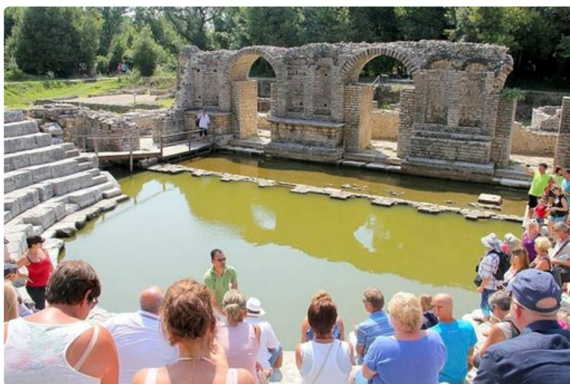
Tanssikengät eivät kastu, sillä maailmantähdille rakennetaan Butrintin amfiteatteriin puinen lava.