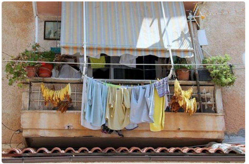
Koltut ja tupakka kuivuvat Sarandassa sulassa sovuissa.