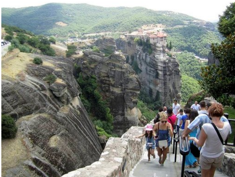
Pääloustarin askelmia kuluttaa katkeamaton turistien virta.