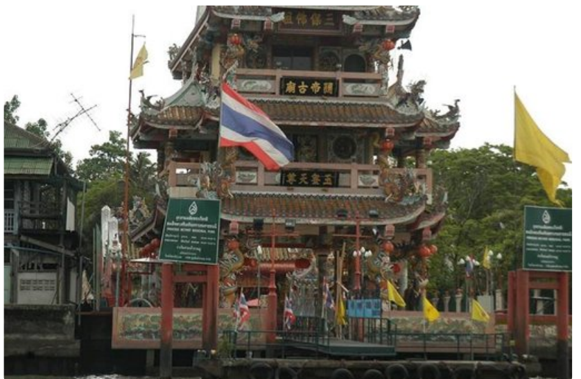
Bangkokissa on vilkas kiinalainen kaupunginosa tuoretoiseen ja tempeleihin.