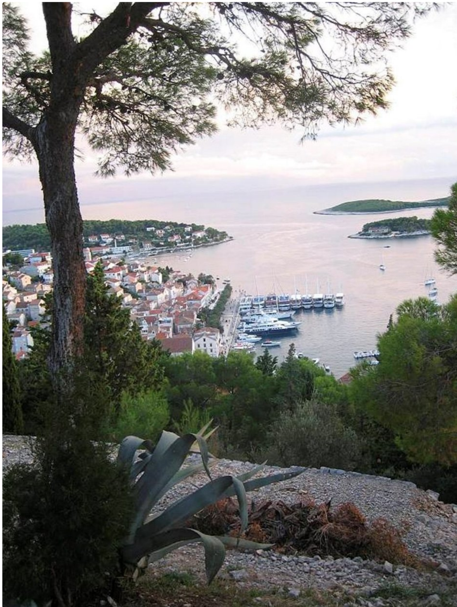
Näköala Hvarin saaren espanjalaisesta linnoituksesta: Lopar pisimmässä laivarivissä äärimmäisenä oikealla.