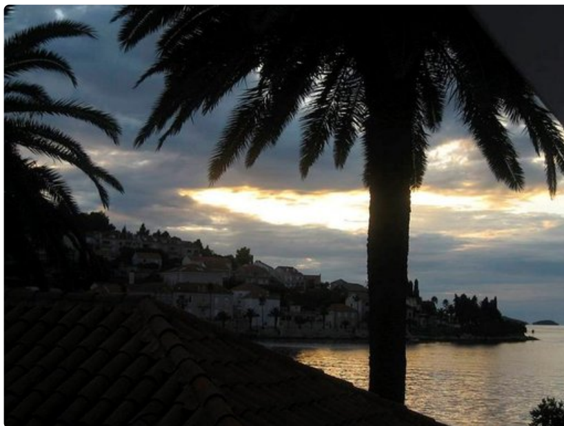
Marko Polon saari, jossa isoäidit pitävät yllä järjestystä.

Oluen hinta baarin tai ravintolan mukaan, alkaen n. 2 euroa/lasi. Talon viini keskihintaisessa ravintolassa n. 10 - 15,- euroa / 0,75 l, laatuviini 0,75 pullossa n. 30,-. Laivalla viinipullo maksoi 12 euroa.