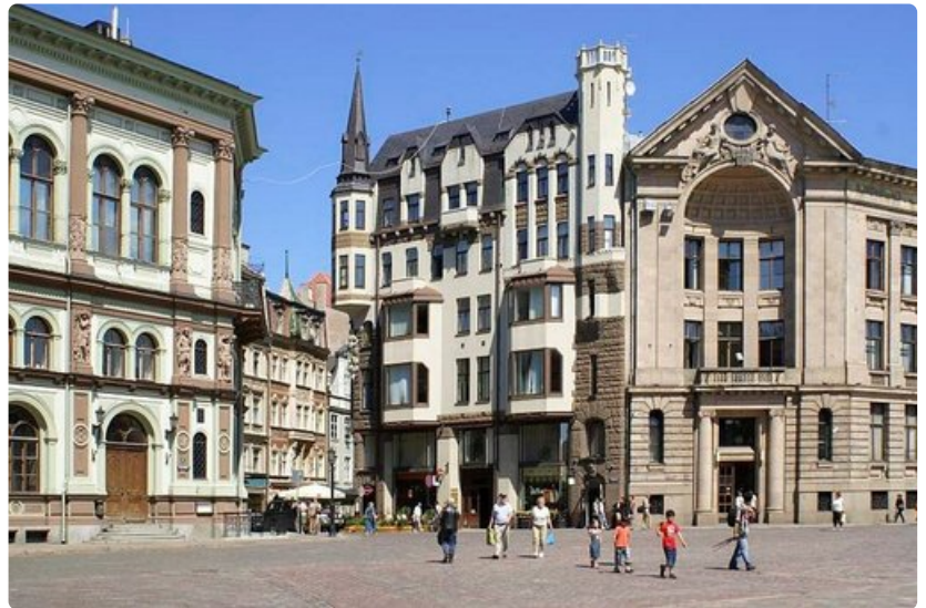
Suomalaisten suosimassa Riiaassa hotellihinnat nousivat vuoden alkupuoliskolla.