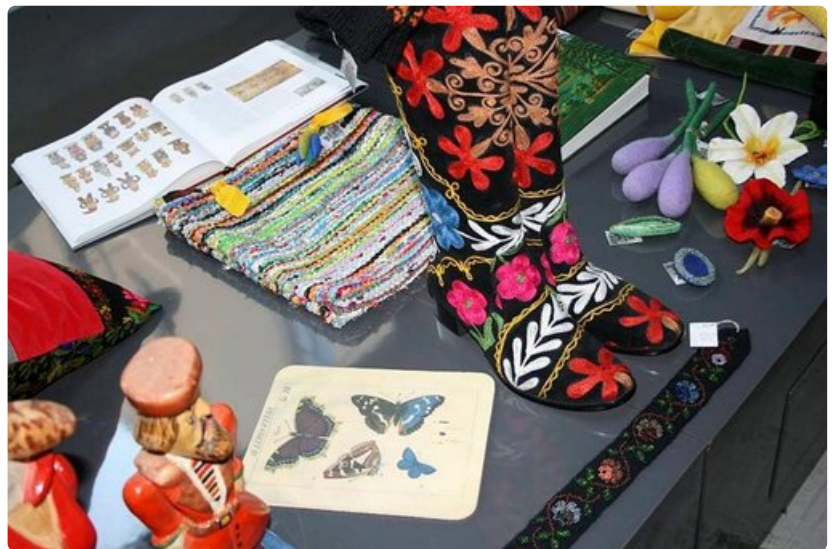
Putiikeissa voi tehdä värikkäitä ostoksia.