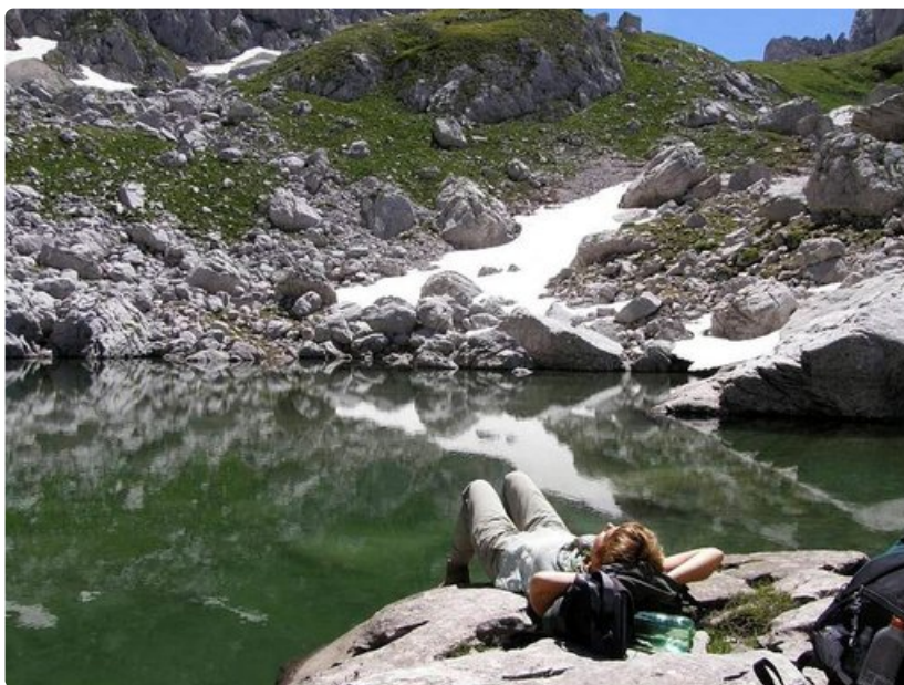
Aurinkoenergian keruuta Zeleni-järven rannalla.