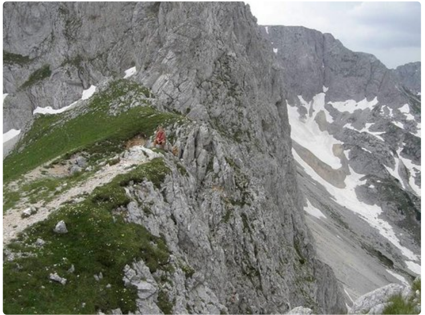
Nousut on paikoin jyrkkiä, mutta maisemat huipulla palkitsevat.

Matkaa on jäljellä noin kymmenen metriä, kun ryhmä vaeltajia laskeutuu huipulta alas. Jään odottamaan.