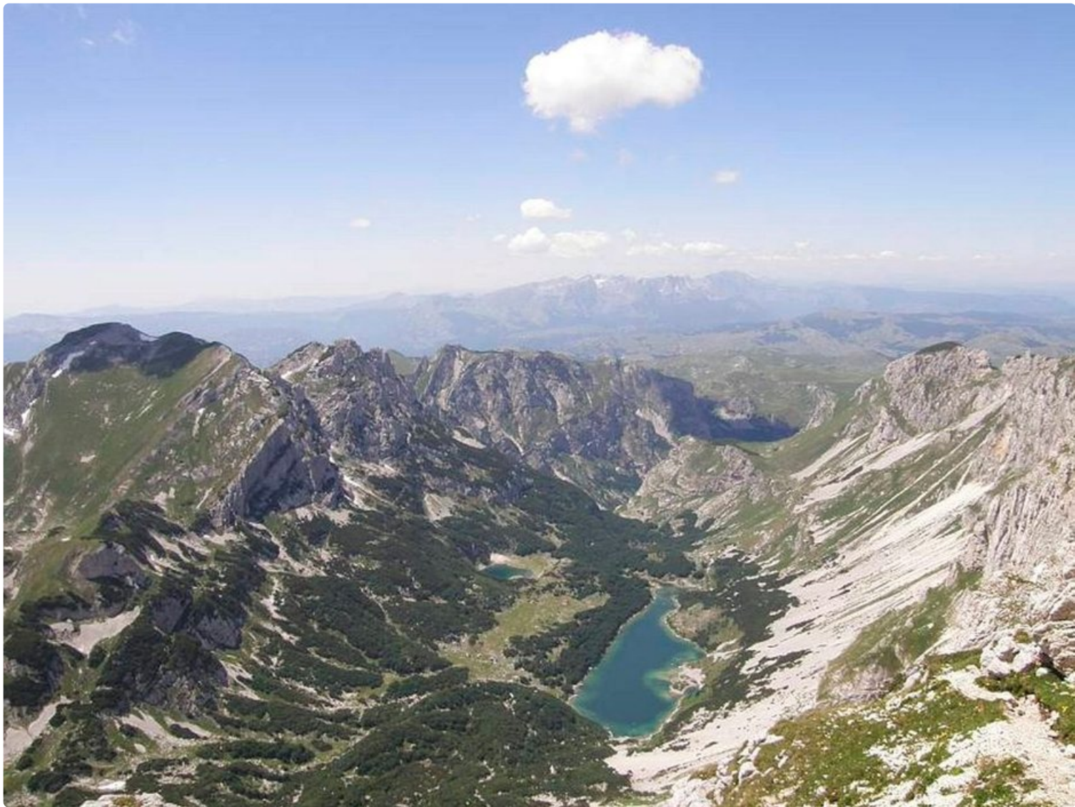
Upeat näkymät Montenegron korkeimmalta vuorelta.