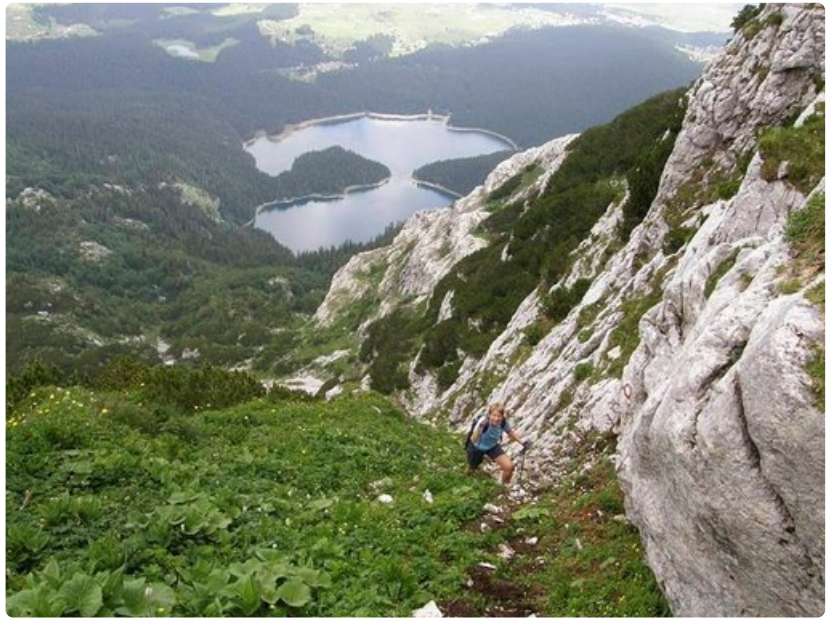
Sauvojen käyttö säästää polvia.

Juuri kun olemme pakkaamassa tavaroita takaisin reppuun, tunnemme värinää ilmassa. Tuntuu kuin ampiainen olisi pistänyt niskaani ja sekuntia myöhemmin näen jotain leijailevan ilmassa miestäni kohti. Se on kuin värisevä näkymätön käärme. Hän parahtaa: "Nyt pois huipulta ja äkkiä!" En ymmärrä, mitä tapahtuu, mutta kiiruhdan juoksujalkaa hissiasemaa kohden. Siellä henkeä vetäessä minulle valkenee, että leijaileva käärme oli sähkömyrsky.