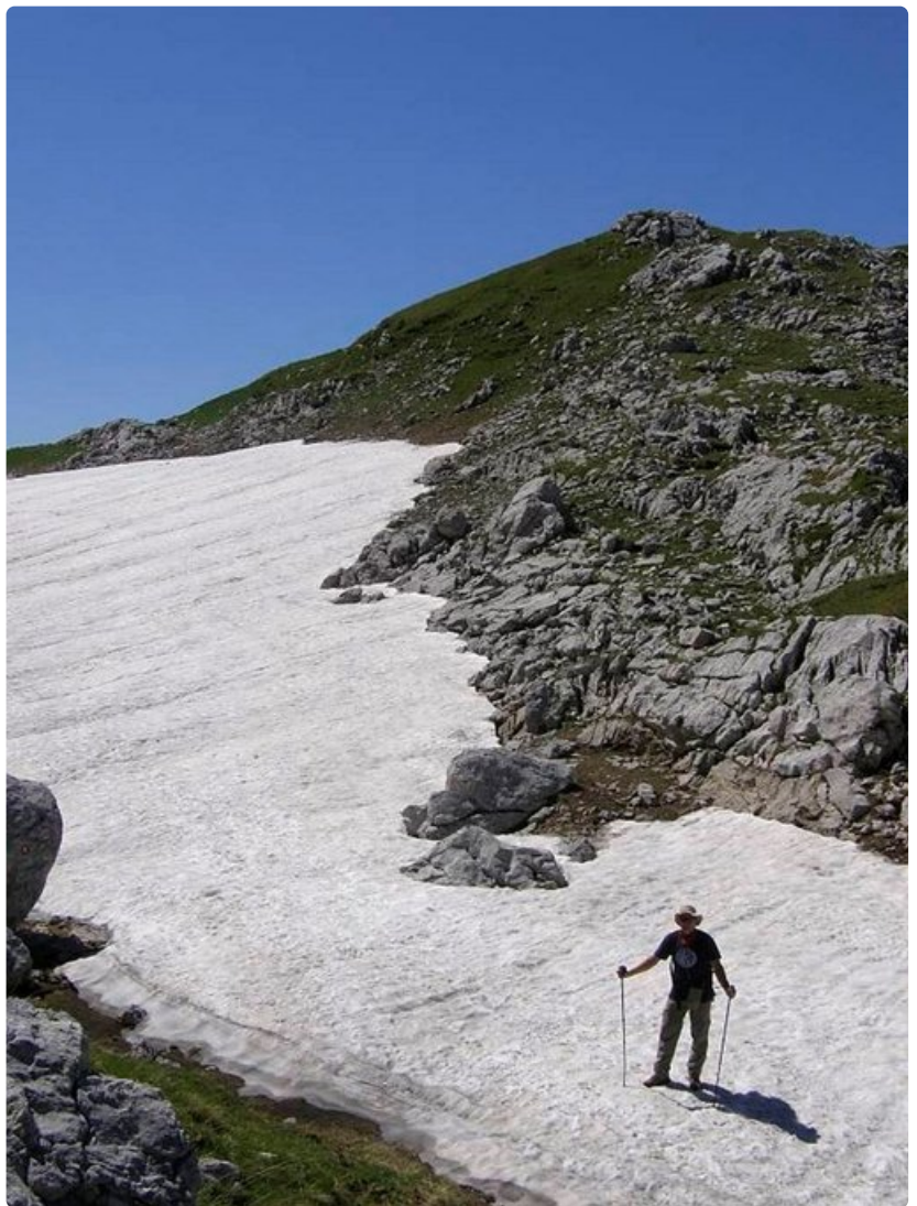
Aurinko heijastuu sokaisevasti lumipalteilta.