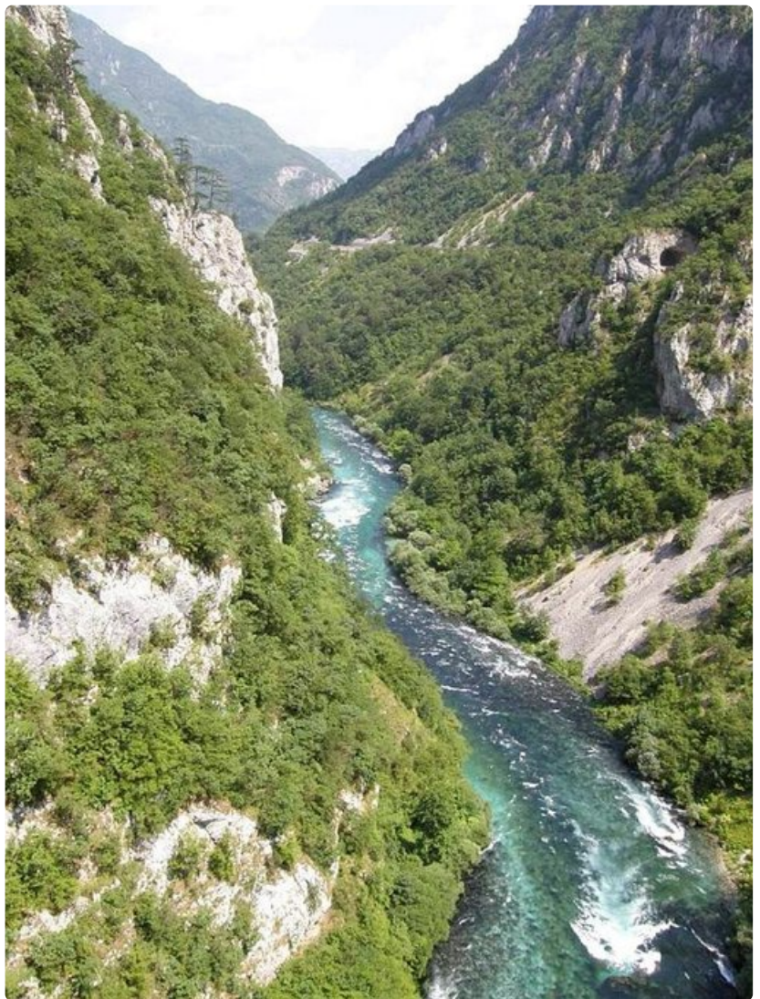
Kirkasvetinen Tara-joki halkoo maisemaa.