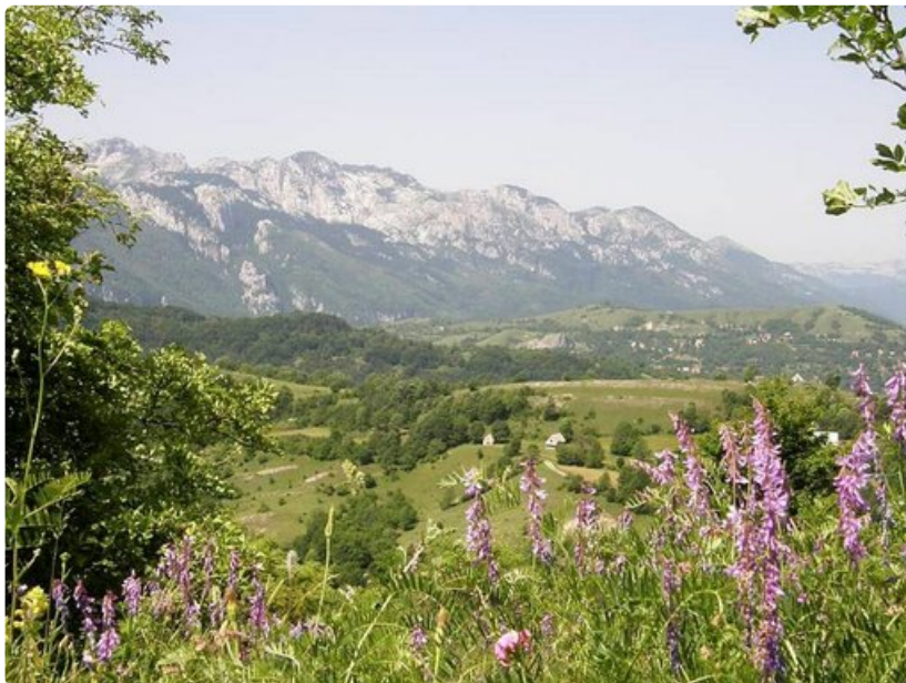
Montenegron kumpuilevaa maaseutua.

Teksti ja kuvat: MARJA HÄMEENNIEMI-OZWELL