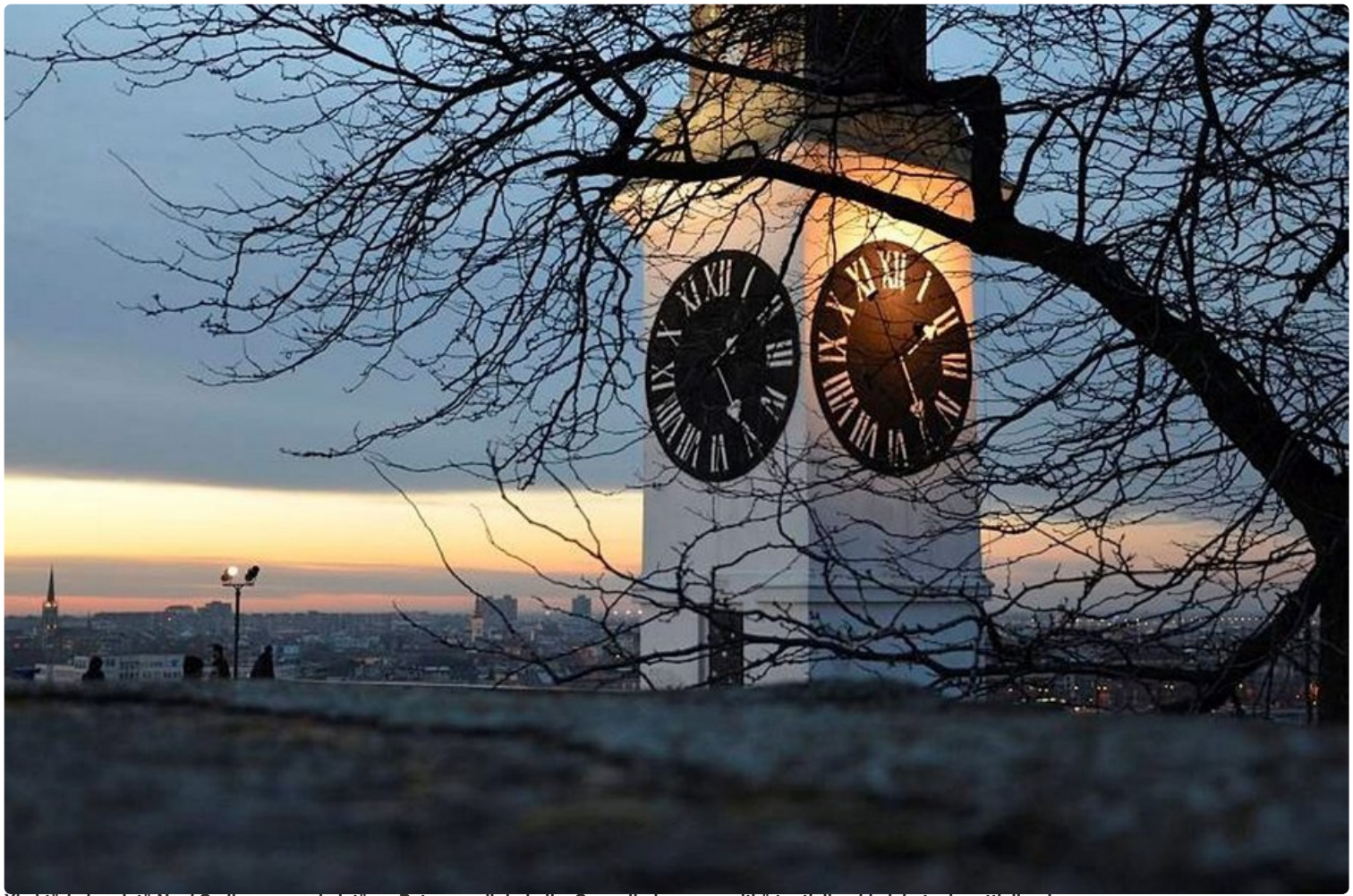
Yksi tärkeimmistä Novi Sadin maamerkeistä on Petrovaradinin kello. Sen erikoisuus on pitkä tuntiviisari ja lyhyt minuuttiviisari.