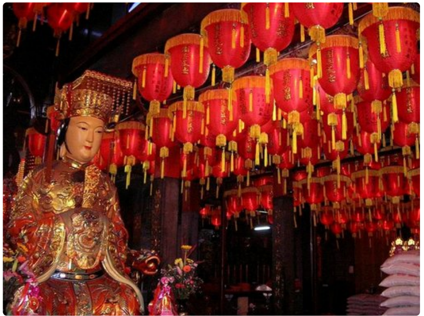
Buddhalaistemppeleiden jumalankuvat ja värikkäät lyhdyt ovat väriäiskä muuten hiukan harmaassa kaupunkikuvassa.

Ilmasto: subtrooppinen, vuoden keskilämpö 22 C, kesällä kesäkuusta syyskuuhun lämpötila voi nousta 40 C asteeseen. Sadepäiviä vuodessa keskimäärin 181, keskimääräinen vuotuinen sademäärä 2 152 mm. Taifuuneja voi esiintyä heinäkuusta lokakuuhun.