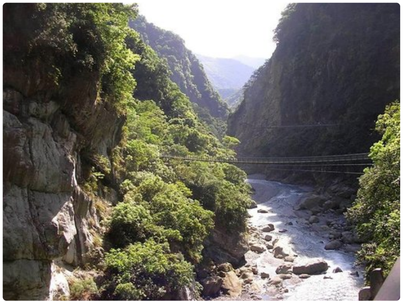
Tarokon rotko on uurtunut marmorikallioiden väliin.