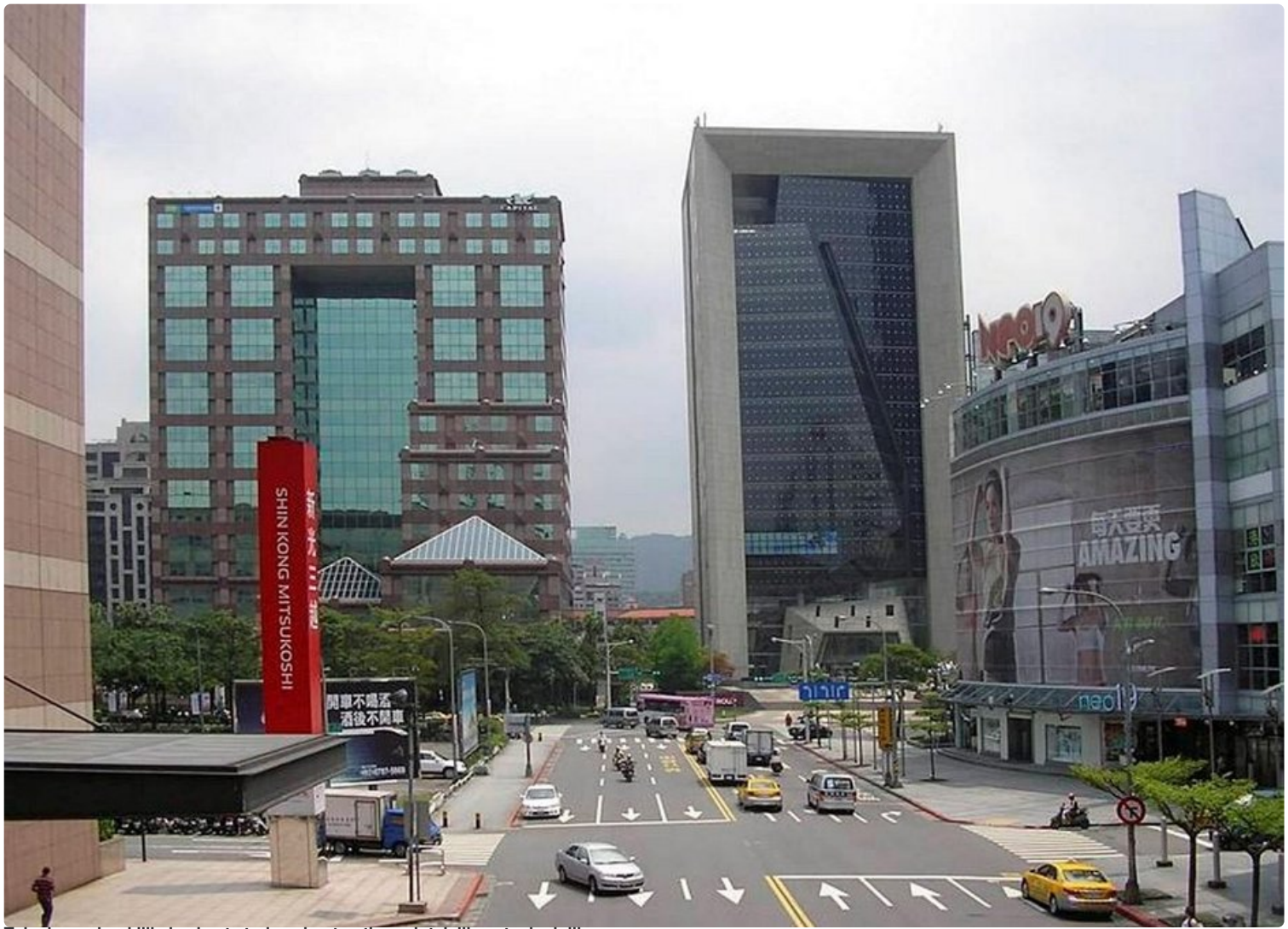
Taipein moderni liikekeskusta tarjoaa kontrastin perinteisille ostoskaduille.