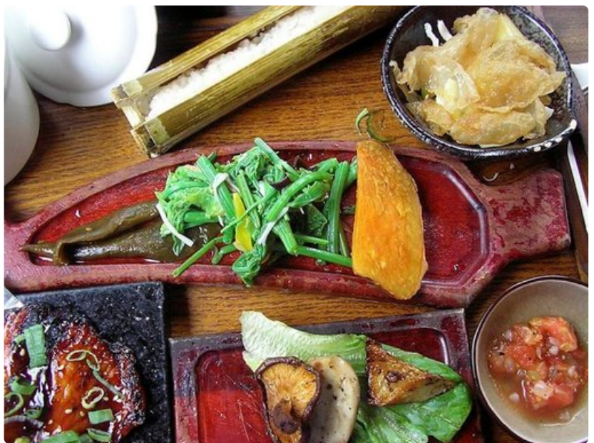
Taiwanilaisten suuri herkku – siansuolet.