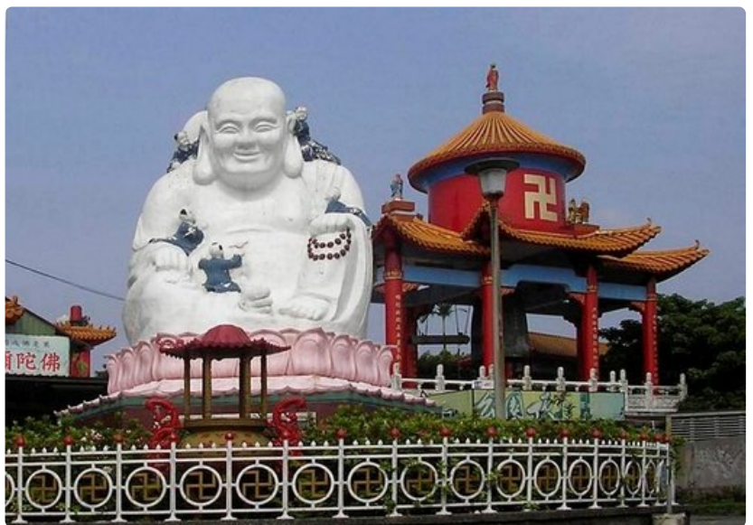
Buddha on näkyvässä joka puolella.