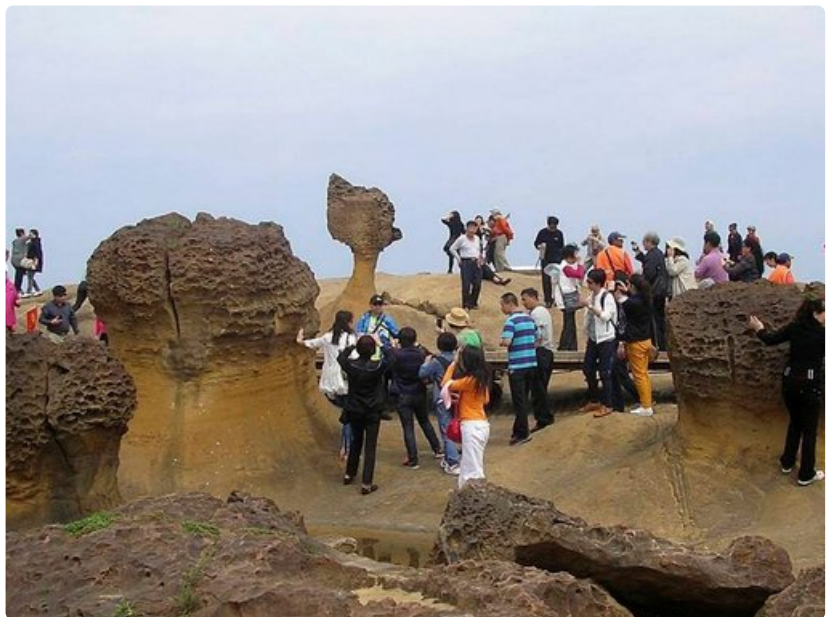
Mannerkiinalaisten matkailijoiden ryhmä ihastelemassa Taiwanin pohjoisrannikon erikoisia kalliomuodostelmia.