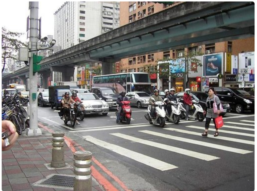
Taipein liikenteelle ovat tyypillisiä hurjaa vauhtia huristelevat skootterit.

Temppeleissä käydessään huomaa asukkaiden harjoittavan hartaasti uskontoaan. Suitsukkeet tuoksuvat, kun erilaisten jumaluuksien edessä kumarrellaan ja uhrataan anottaessa ratkaisua milloin mihinkin elämäntilanteeseen. Hämmästyttävää on, etteivät rukoukset vähääkään tunnu häiriytyvän ympärillä parveilevista ja valokuvia ottavista matkailijoista. Tämä kuvastaa osaltaan sitä suurta suvaitsevuuksia, joka leimaa taiwanilaisten uskonnon harjoittamista.