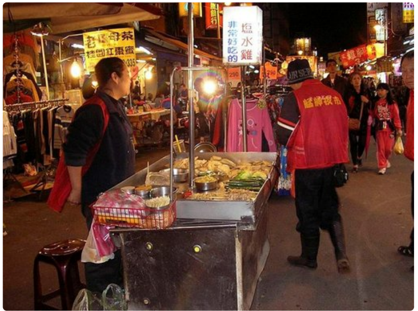
Taipeilaisen iltatorin elämää.

Taipeissa on hotelleja joka lähtöön. Siellä ovat eräät maailman kiistattomista huippuhoteleista kuten legendaarinen Grand Hotel, joka on joskus luokiteltu maailman ykköseksi. Luksushoteleissa on luonnollisesti luksushinnat. Toisaalta keskitason hotellit jopa keskikaupungilla ovat kohtuullisen edullisia. Parin viikon valmismatkan Helsingistä Taipeihin saattaa saada jopa puolellatoistuhannella eurolla.