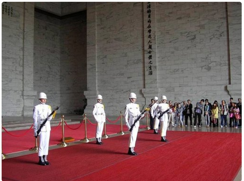
Vahdinvaihto Tsiang-kai Shekin muistohallissa Taipeissa.